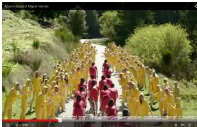
Figura 10 6

En lo que se refiere a los soportes audiovisuales, resulta interesante analizar la figura 10, que, con el objetivo de conectar con el tópico de la salud, utiliza la figura del famoso ciclista Miguel Induráin como argumento de autoridad, debido a que este constituye un reflejo del estereotipo social relacionado con un estilo de vida saludable. El mensaje realiza un inciso explicativo, centrado en la forma en que el colesterol impide el flujo normal de la sangre en las arterias, mediante una metáfora visual, que conecta con la experiencia cognitiva del destinatario.