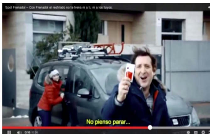
Figura 5 4

Es el caso de la figura 5, que combina de forma ingeniosa varios sistemas semióticos, entre los que destaca especialmente la música. La letra de la canción seleccionada («Don't stop me now», del grupo inglés Queen) guarda una estrecha relación con las diferentes escenas del anuncio, que muestran momentos felices de la vida cotidiana, que pueden verse afectados y, en consecuencia, interrumpidos, a causa de un resfriado. El producto, por tanto, se presenta como la solución para evitar que un resfriado común interfiera en la vida cotidiana del consumidor y conecta a la perfección con el universo experiencial del receptor.