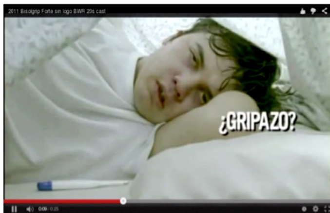
Figura 13 8