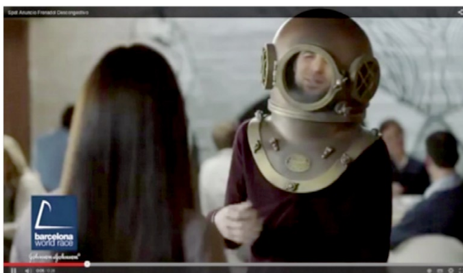
Figura 12 7

producto anunciado. Por tanto, en este caso, no se trata tanto de explicar las propiedades médicas del producto anunciado como de demostrar la funcionalidad del producto, mediante la apelación a aspectos de carácter emocional, como el deseo sexual y la necesidad de sentirse aceptado por el sexo opuesto.