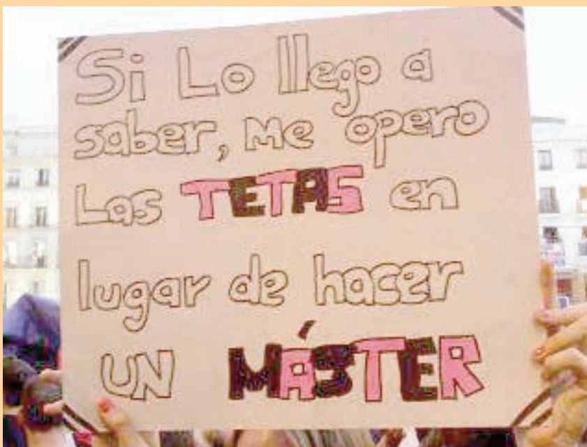
Una pancarta a la setmana

Igual no les han posades encara perquè estan mirant de regatejar el preu de la colla que les ha de muntar, les barreres volem dir. Diu que Mariano, i de retruc ZP no us oblideu, ens ha reduït un 20% el pressupost de festes... i pel que sabem encara ens pareix poc perquè anuncien a bombo i platerets que han omplert el programa amb 200 o 300 actes (ací les fonts no es posen d'acord) "con mucha imaginación". Ja tremolem i ens fan figa les cames quan ens tirarem a la cara el llibret de festes. Si de normal, ja són com són, imagineu ara quins "actes" ens esperem.