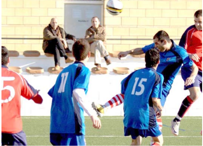
Prenent el sol com els fardatxos.