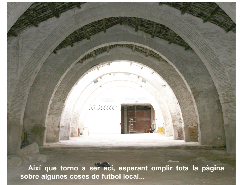
Així que torno a ser ací, esperant omplir tota la pàgina sobre algunes coses de futbol local...

mina que farà que aquesta pàgina pugui ser omplida sense dificultats.