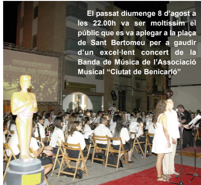
El passat diumenge 8 d'agost a les 22.00h va ser moltíssim el públic que es va aplegar a la plaça de Sant Bertomeu per a gaudir d'un excel·lent concert de la Banda de Música de l'Associació Musical "Ciutat de Benicarló"

tot això, s'espera poder comptar amb tots ells i amb tot aquell que vulguia participar l'any que ve, per tal de que L'Arjup a l'aire torne a ser un any més, una proposta entretinguda, diferent i en família.