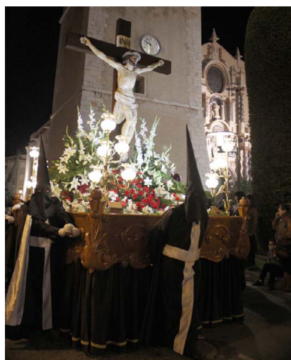
Cristo de Paz