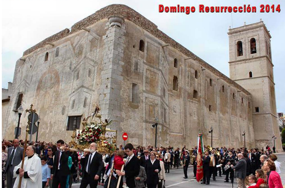
Domingo Resurrección 2014