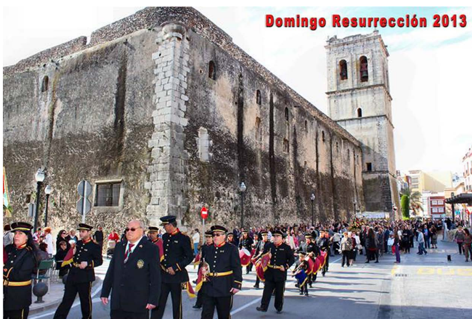
Domingo Resurrección 2013

Medina: "Estamos acercando la Policía Local a los ciudadanos para que éstos se sientan más seguros"