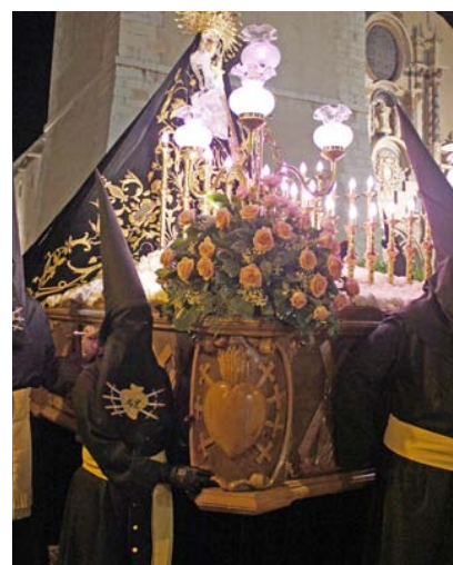
Virgen de los Dolores