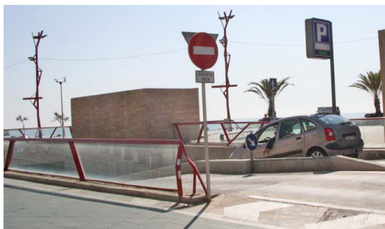
Los clientes tendrán media hora gratuita en el parking del paseo

Media hora gratuita para los clientes que estacionen en el aparcamiento subterráneo del paseo marítimo. Es lo que ofrecen la Asociación de Vendedores del Mercado municipal y la Asociación de Comerciantes de Vinaròs, que a través de la concejalía de Comercio, han negociado con la empresa concesionaria este nuevo incentivo para favorecer las compras en el centro de la ciudad. Bajo