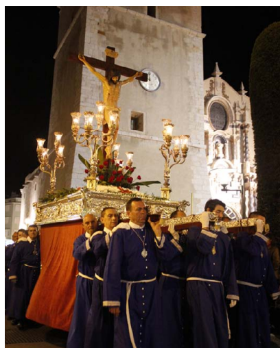
Crist dels Mariners