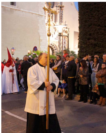
Cruz de guía