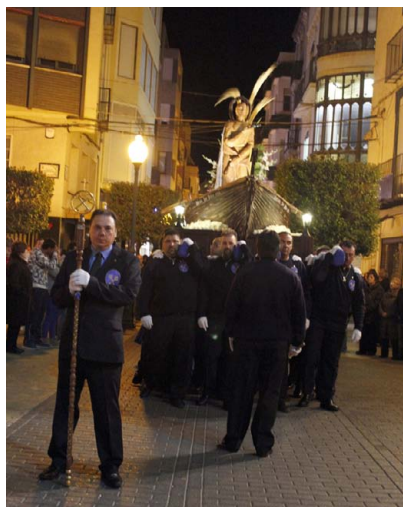
Paso de San Pedro