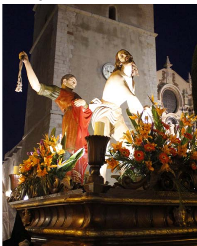
Azotes en la Columna