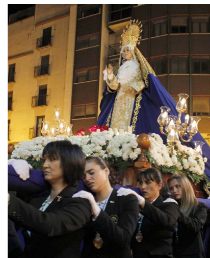
Ntra. Sra. de la Merced