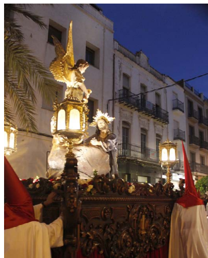
Oración del Huerto