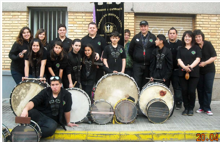
Banda Cristo la Paz El pasado domingo La banda Cristo la Paz despierta a la ciudad...aquí en casa la "Presi"