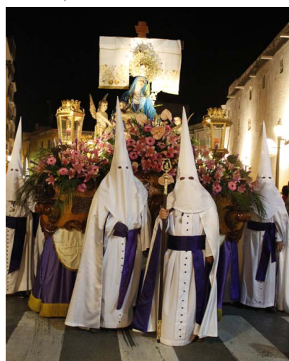
Virgen de las Angustias