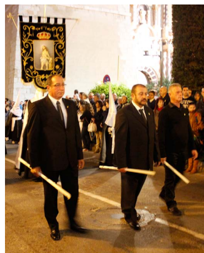
Dolçainers i Tabaleters de Vinaròs