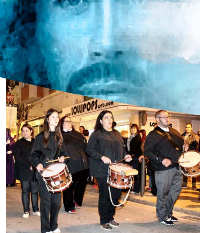
Dolçainers i Tabaleters de Vinaròs