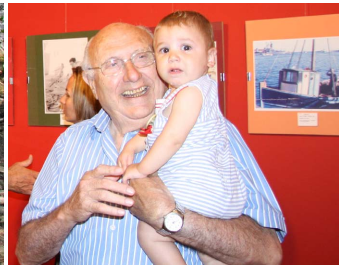
Premi 'Manuel Foguet' per a Joaquín Simó