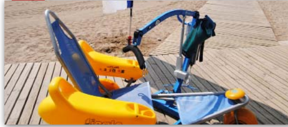
Nova grua accessible al Fortí