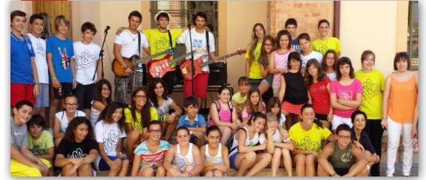
L'Illa: primera quinzena de juliol