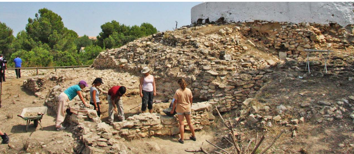
Les excavacions al Poblat del Puig localitzen ceràmica etrusca