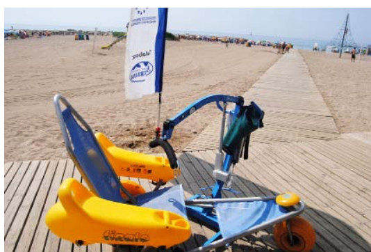
La nova grua permet traslladar amb comoditat, als usuaris de la cadira amfíbia

El nou equipament, amb un cost de 935 euros, s'ha adquirit gràcies a una subvenció de la Conselleria de Benestar Social