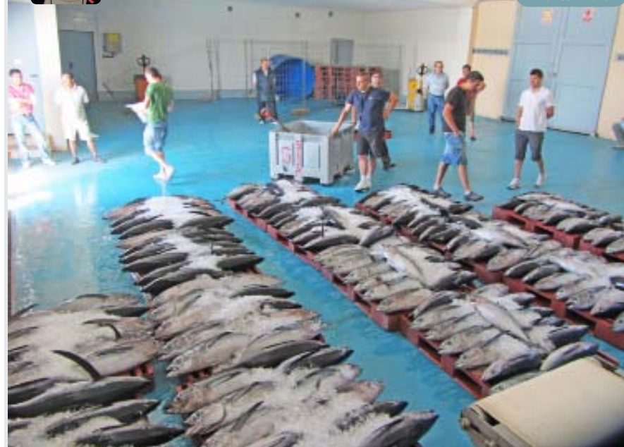
Desembarcos de albacora capturados con anzuelo