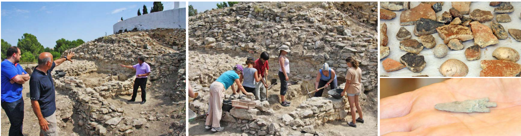
En 15 dies de treball s'ha localitzat puntes de fletxa, ceràmica indígena local feta a mà i també ceràmica d'importació fenícia i especialment l'etrusca, la primera vegada que es troba en la zona

És la primera vegada que es troba ceràmica etrusca en el nord de la província