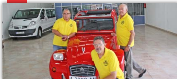
De viatge en 2CV per Europa