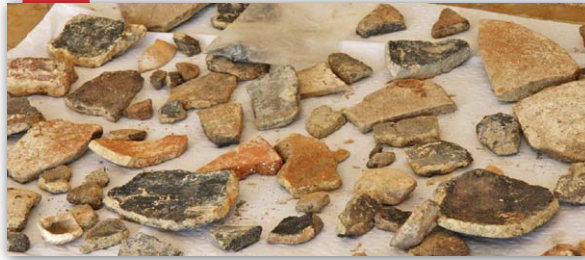
Excavacions al poblat del Puig