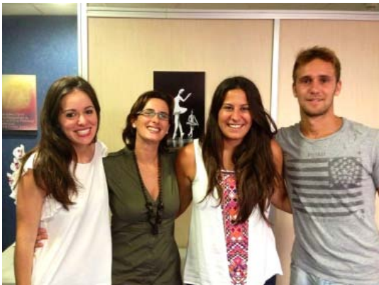
Las becas concedidas tienen una duración de dos meses

Tras el proceso de selección realizado hace ya unas semanas a principios del mes de julio se han incorporado los 4 becarios beneficiarios de las becas que el Ayuntamiento de Vinaròs y la Diputación de Castellón han ofertado para este verano.