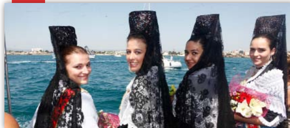
Festes del Carme