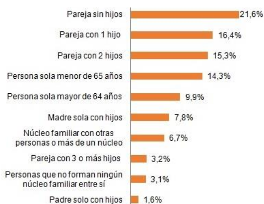
FIGURA 1. Tipus de llar 2013. (Font INE 7-2014)

Especificat cada model familiar i confirmada la presència de diversitat, es fa necessari acompanyar-la de dades ja que, com indiquen Leonhard i Mateo (2010, p.114), “qualsevol investigació o treball que parle de la família i les seues estructures no pot obviar les dades que aporten les estadístiques de població”. Si fem una ullada al Boletín Informativo del INE publicat en juliol de 2014 que descriu les formes de convivència per al 20é Aniversari de l'Any Internacional de la Família se n'adonarem de tota la diversitat familiar existent. Les dades mostren que el nombre de llars augmenta any rere any però que cada vegada estan integrats per un menor nombre de membres.