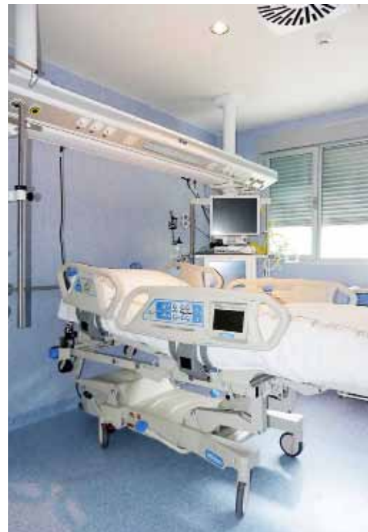
Imágenes de archivo de la ampliación del hospital

Fuentes del Departamento de Salud de Vinaròs han señalado que "la superficie de la UCI se incrementa desde los 160 metros cuadrados actuales a los más de 400 metros cuadrados con la ampliación, un hecho que mejorará la calidad que reciben nuestros pacientes".