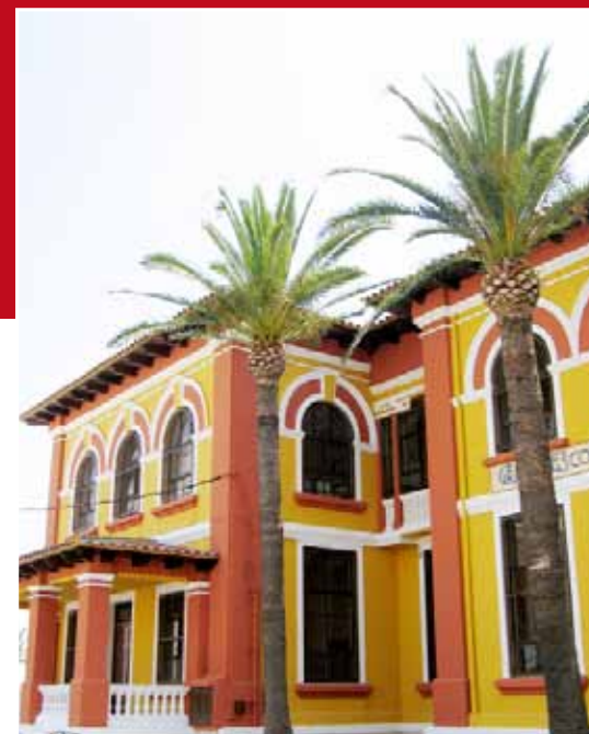
Dejará de ser la sede de la EPA y de la escuela de música para pasar a ser una sala de exposiciones.

Como aquella vieja canción del mexicano Vicente Fernandez, el Partido Popular se sigue sintiendo el Rey, es inexplicable que hace 1 mes, atemorizaran a los ciudadanos amenazando de no pagar a funcionarios ni a proveedores, y ahora revistan de mármol las escaleras del ayuntamiento, acicalen el despacho a la medida de la señora Medina, rehabiliten los antiguos juzgados para ponerse nuevos despachos... y para rubricar unos perfectos 100 días, advierten del desalojo de la EPA y de la Escuela de Música del antiguo colegio Sant Sebastià, para transformarlo en una sala de exposiciones. Pero lo que verdaderamente nos tendría que preocupar es que todavía les quedan 1360 días para seguir sintiéndose los reyes.