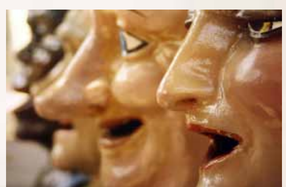
Una d'aquestes tres imatges il·lustrarà el cartell de la pròxima trobada de nanos i gegants. Els assistents a l'exposició de l'auditori municipal poden votar quina és la que més els agrada