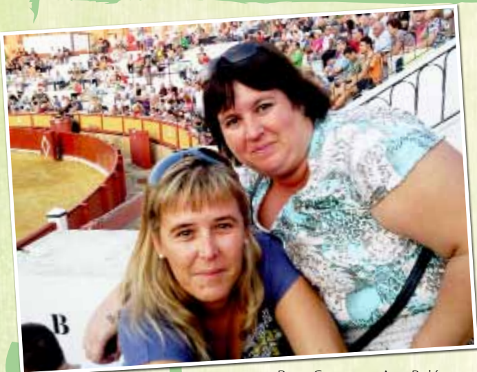
Toros Rosa Carmen y Ana Belén en la plaza de toros