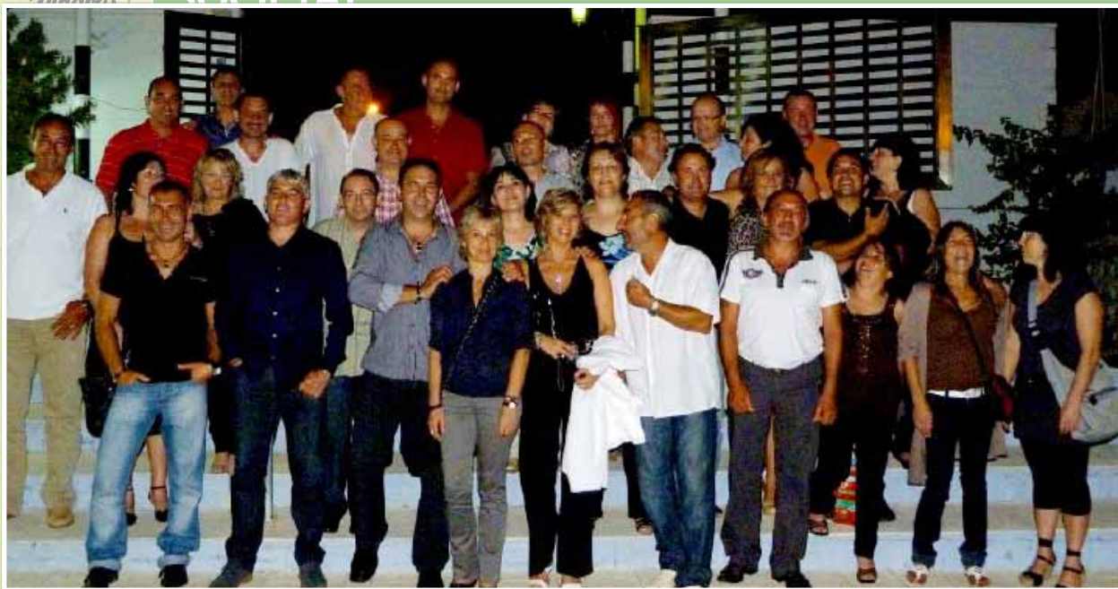
Cena Antiguos alumnos del colegio La Asunción (1980-1981) nos reunimos de nuevo después de 30 años. Pasamos una noche inolvidable llena de emotivos recuerdos. ¡Fantástico reencuentro, repetimos seguro! Gracias a todos los que vinisteis. Hasta la próxima.