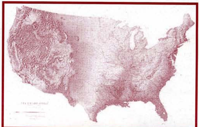
The United States

—La verdad es que estoy muy contenta de haber venido aquí; he aprendido mucho sobre vuestra lengua, vuestra cultura y he conocido a mucha gente. Los estudiantes Erasmus solemos ir juntos, pero también tengo amigos españoles que me han enseñado sus costumbres y el funcionamiento del sistema universitario, que es muy diferente del alemán.