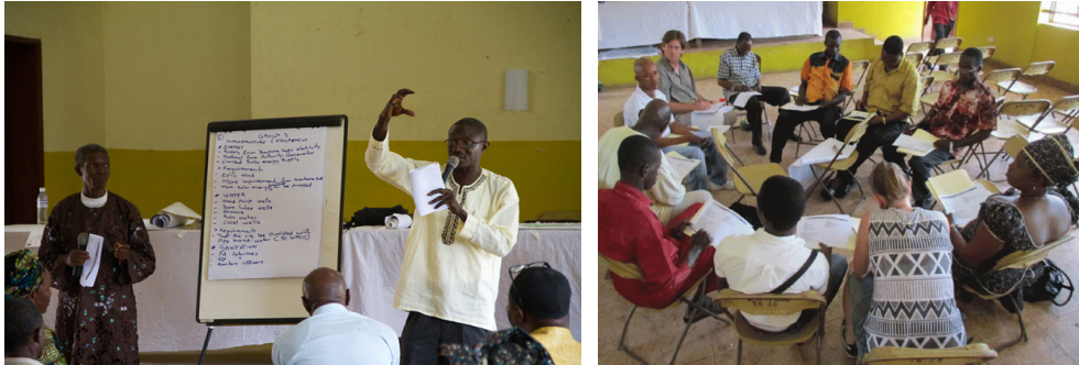
Imágenes 3 y 4. Foros participativos de Makeni. Hacia un Makeni sostenible, julio de 2013