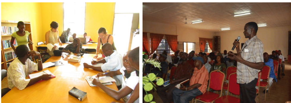
Imágenes 1 y 2. Foros participativos de Makeni. Hacia un Makeni sostenible, julio de 2013

En julio 2013 y enero 2014 se realizan 2 grandes foros en la ciudad de Makeni, con todas las partes implicadas presentes (universidades, administración y grupos locales de acción), que ponen sobre la mesa las aproximaciones a los principales problemas urbanos de Makeni.