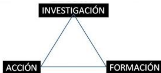
Figura 1. Triángulo de Lewin

Lewin (1946) define la IA como un triángulo que contempla la necesidad de la investigación, la acción y la formación como tres elementos esenciales para el desarrollo profesional (figura 1). Los tres vértices del ángulo deben permanecer unidos en beneficio de sus tres componentes. La interacción entre las tres dimensiones del proceso puede representarse bajo el esquema del triángulo.