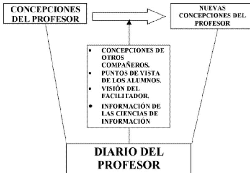
Figura 5. Diario del profesor.

Para la observación de la exposición oral, se tuvo en cuenta la rúbrica correspondiente (anexo I). Tanto el tutor como el investigador al finalizar las sesiones comparaban las notas y decidían la nota final. Además del propio diario que se escribió durante la realización de éstas. Algunas de las anotaciones de la exposición oral fueron: