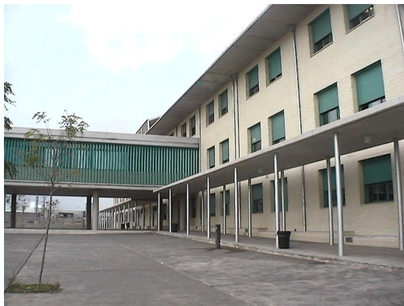
Figura 3. Vista del lateral del centro

Este TFM se ha llevado a cabo en el I.E.S. Professor Broch i Llop (figura 3), durante los dos meses de estancia de prácticas. Este centro es el más nuevo de todo el municipio de Vila-real, siendo en el curso 2004/2005 el primero de su historia.