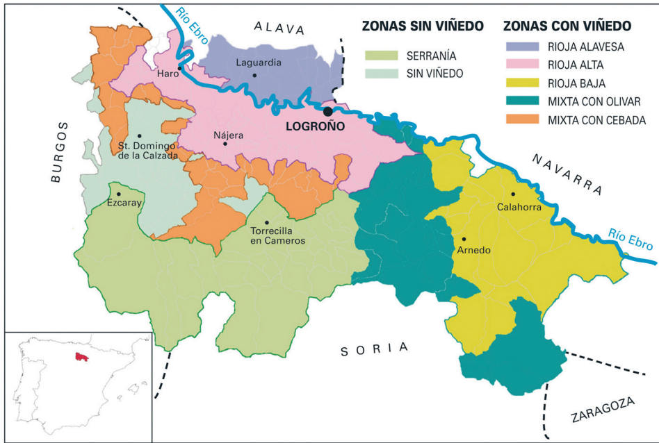
MAPA 1 Zonas geográfico-agrícolas de La Rioja en el siglo XVIII