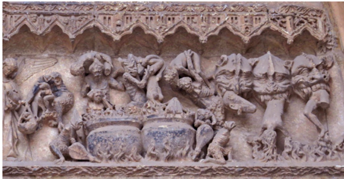
Fig. 5. Detalle de las calderas del infierno de la puerta del Juicio Final de la Catedral de León.

una gran boca que engulle, que se alimenta de los malvados: en el interior de esta boca el diablo, Pedro Botero, cocina a fuego lento, durante toda la eternidad, a aquellos que no han cumplido los mandamientos.