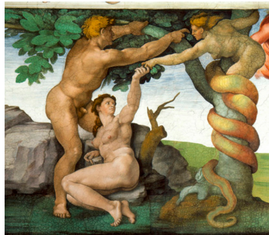
Fig. 12. Miguel Ángel. El Pecado Original (1512). Capilla Sixtina, Roma.

sustituyendo a la serpiente del árbol del Paraíso (fig 11). Sin duda el mejor exponente de la diablesa en la escena del pecado original es el del fresco de Miguel Ángel de la bóveda de la capilla Sixtina (fig.12). Otros ejemplos de la representación del diablo como diablesa los encontramos en los pasos procesionales, entre los que destaca la Roca Diablera (siglo XVI) de la procesión del Corpus de Valencia o la diablesa del paso procesional de la Santa Cruz de la Semana Santa de Orihuela, obra de Nicolás de Bussy de 1695.