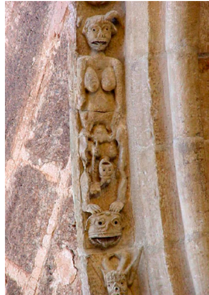
Fig. 10. El parto de la diablesa . Arquivolta de la Iglesia de Cifuentes, Guadalajara 1 .