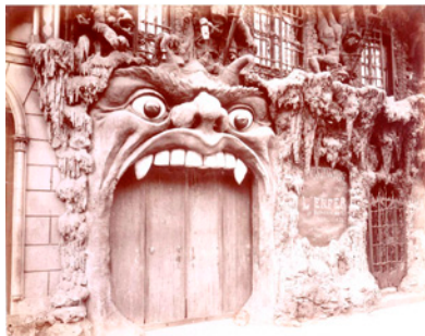
Fig. 15. Puerta de acceso al Cabaret de l'Enfer , en el barrio de Montmartre, París.

La estética de este cabaret reproducía el tipo iconográfico de los infiernos medievales con la gran boca representada en la puerta para engullir a los pecadores que buscan diversión ya que en su interior en lugar de tormentos se ofrecían atracciones diabólicas (fig. 16).