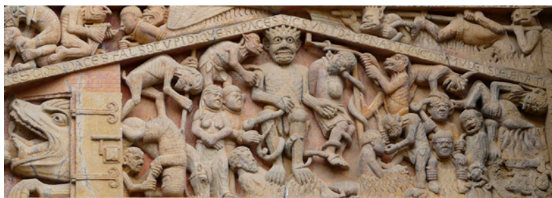
Fig. 4. Detalle de la puerta del Juicio Final de la Iglesia de Sainte-Foy de Conques, Francia.

En la portada de la iglesia de Sainte-Foy de Conques encontramos en una de las filacterias el término «Tártaro», palabra de la tradición clásica para referirse al infierno (fig. 4). Únicamente hay una mujer condenada por adúltera junto con su amante –tal y como se explica en la filacteria superior– y el resto de los condenados son hombres. Siguiendo el código medieval, se representa el adulterio mediante la imagen de una pareja atados con un cordel por el cuello: ella con los pechos desnudos, él con las manos atadas. Ambos son acompañados por un demonio situado sobre ellos que está susurrando al oído a Satán el motivo de la condena: el pecado capital de lascivia.