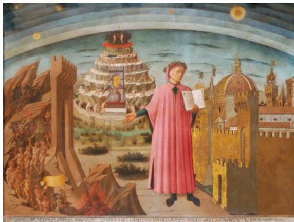
Fig. 8. Domenico di Michelino. Dante y la Divina Comedia (1465). Fresco de la Catedral de Florencia.

La fuente iconográfica que inspiró la pintura de Fra Angélico proviene del imaginario común medieval que encontramos en el códice miniado del Hortus Deliciarum . Otra posible fuente de inspiración pudo ser el fresco de la Capilla Scrovegni de Padua pintado por Giotto