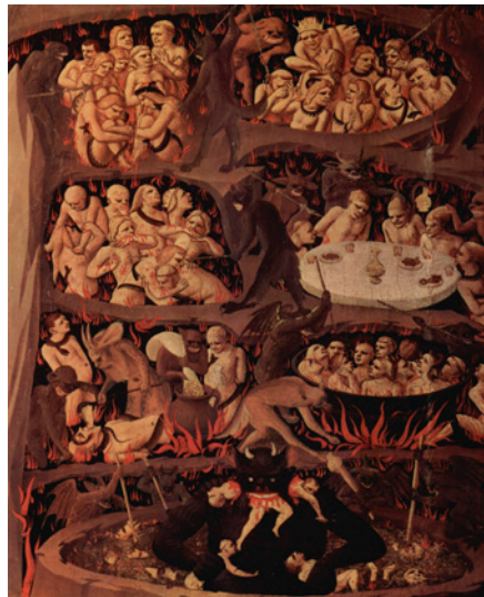
Fig. 7. Detalle del infierno de El Juicio Universal de Fra Angélico (1432-1435). Tabla al temple de 105 x 210 cm. Museo de San Marcos de Florencia.