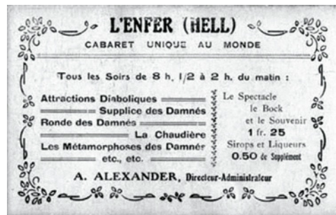
Fig. 16. Anuncio publicitario del cabaret.