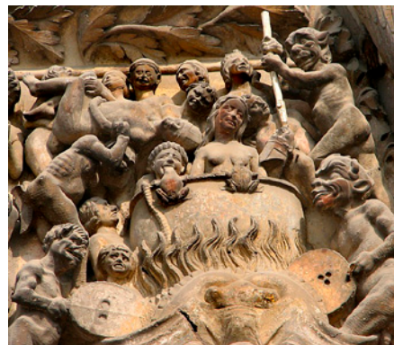
Fig. 1. Detalle de la boca del infierno de la portada de la Iglesia abacial de Sainte-Foy de Conques, Francia.