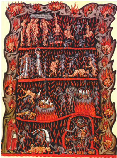
Fig. 6. Dibujo miniado del infierno del libro de Herrada Von Landsberg titulado Hortus Deliciarum (1165). Copia del original de 1818 por Christian Moritz.

una gran boca que engulle, que se alimenta de los malvados: en el interior de esta boca el diablo, Pedro Botero, cocina a fuego lento, durante toda la eternidad, a aquellos que no han cumplido los mandamientos.