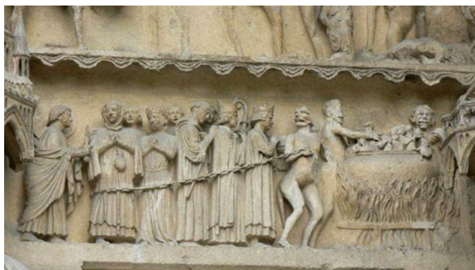
Fig. 3. Detalle de las calderas del infierno de la Puerta del Juicio Final de la Catedral de Reims, Francia.

Otro ejemplo lo encontramos en la Catedral de Reims (fig. 3). El tímpano de la portada nos presenta el cortejo de los condenados, quienes, vestidos con ricos trajes, son dirigidos encadenados por el diablo a las calderas. A la izquierda de esta imagen podemos ver al arcángel San Gabriel (que fue, como ya sabemos, el que expulsó a Adán y Eva del paraíso) empuñando una espada de fuego con la que empuja a los encadenados al infierno. Entre los pecadores se distinguen reyes, obispos, frailes... y al final de la cadena hay dos mujeres: una de ellas porta en sus manos una bolsa que revela que el motivo de su condenación fue la avaricia.