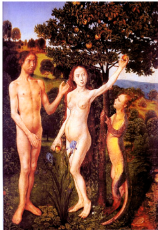
Fig. 11. Hugo van der Goes. El Pecado Original (1467 aprox.). Kunsthistorisches Museum, Viena.