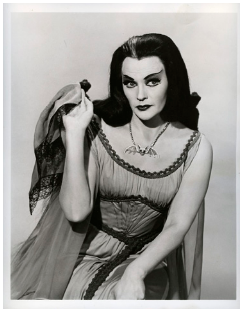
Fig.17. Yvonne de Carlo, Lily en la serie televisiva The Munsters (1964-1966).

La visualidad de las mujeres en el infierno contemporáneo ha tenido un cambio de significación que afecta incluso al universo infantil y juvenil. Podemos destacar el éxito que tuvo en los años 60 la serie televisiva The Munsters en la que Yvonne de Carlo interpretaba el papel de Lily convertida en paradigma de la estética gótica entre los adolescentes (fig. 17); y el furor causado por las muñecas Monster High de la firma de juguetes Mattel entre las que destaca Lilit, la diablesa más popular entre las niñas (fig.18). Las Monster High se han convertido en un fenómeno cultural liderando en España las ventas de muñecas en las navidades de 2012 y desbancando del primer puesto al producto estrella de Mattel: la muñeca Barbie .