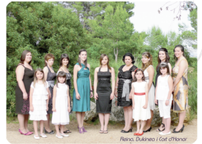
Reina, Dukinea i Cot d'Honor

I arribem a les degustacions oferides per les associacions i