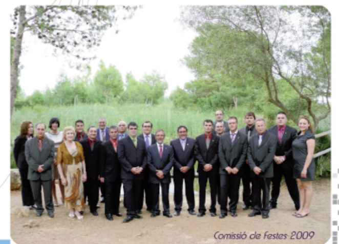
Comissió de Festes 2009

penyes, que supleixen la poca sensibilitat i solidaritat municipals amb els difícils moments que passen les nostres economies. Si un s'ho monta be, les degustacions poden allargar-se fins a convertir-se amb autèntics àpats. Sempre està el truc de "per a la meua iaia" o "posem un poquet més i el xiquet ja menjarà de la meua, i així no cal que me'n pose un altra ració, gràcies".