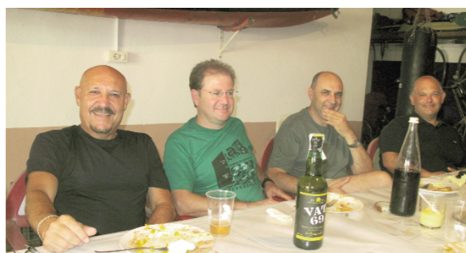
La cultura i van 2