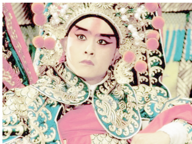
Amb un creatiu model de fallera major d'estil xinés