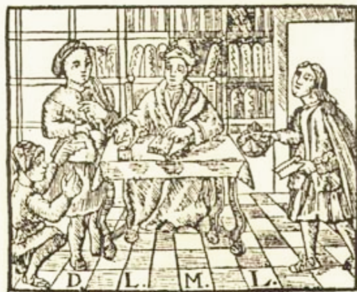
EXCM. AJUNTAMENT DE VALÈNCIA FESTA DEL LLIBRE.-1933