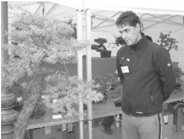
Tenim el major col·lectiu d'aficionats d'Espanya