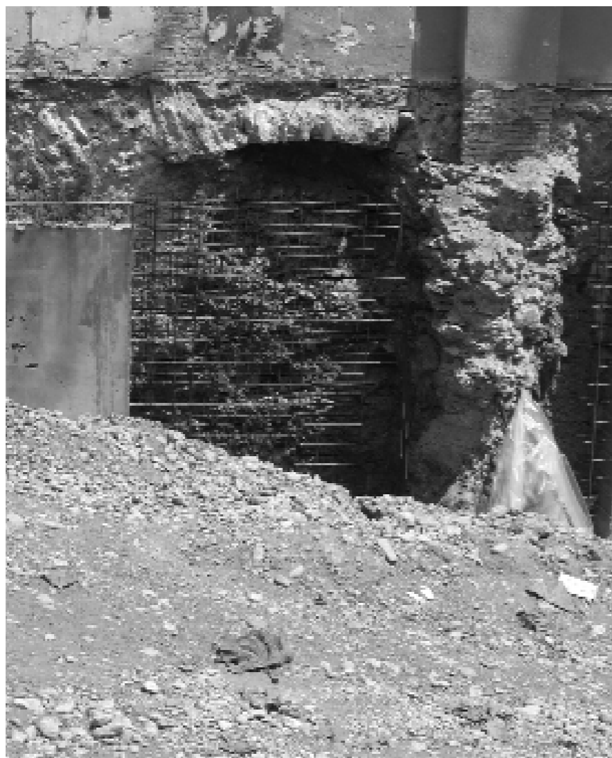
Un dels últims vestígis de la muralla que també va desaparèixer

L'organització del convent gira entorn a un claustre de menudes dimensions estant en un dels seus costats l'església. Les dependències conventuals com la cuina, refetor, cel·les, tallers, etc., es desenvolupaven en dues edificacions de planta rectangular i tres pisos, que s'articulen perpendicularment. Els forjats de les diferents plantes són de bigues de fusta i bovedilles. La coberta exterior és de teula àrab. La fàbrica del conjunt és de maçoneria