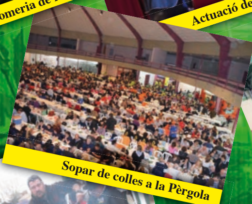
Sopar de colles a la Pèrgola