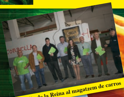
Visita de la Reina al magatzem de carros