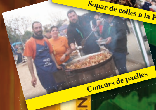
Concurs de paelles