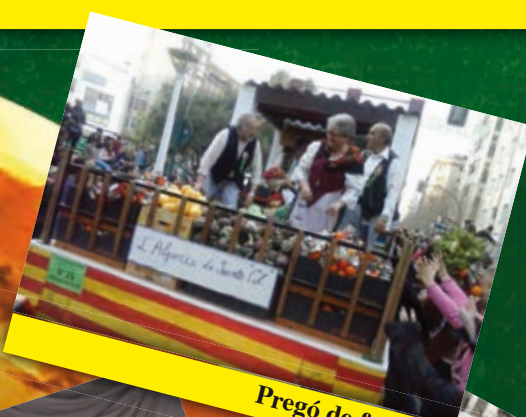
Pregó de festes