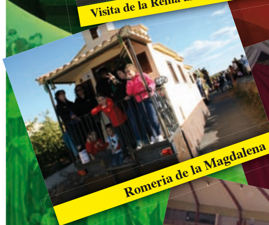
Romeria de la Magdalena