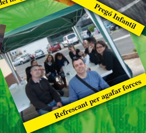
Refrescant per agafar forces