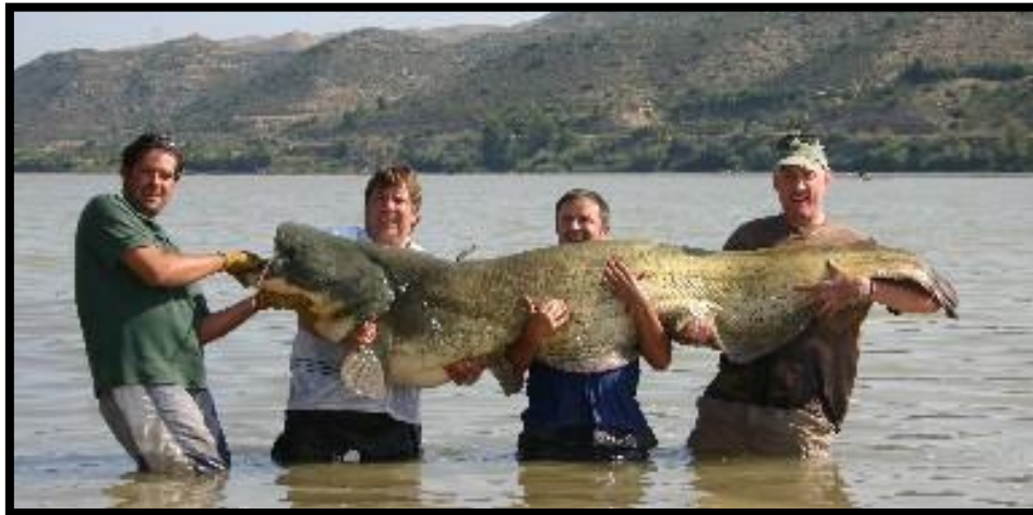
Imagen 1. Siluro

A través de los resultados, al final del mismo se ofrecerán las propuestas y conclusiones derivadas del presente estudio.