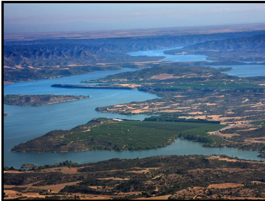
Imagen 5. Panorámica del Ebro a su paso por Caspe