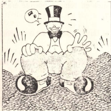
—Especulador eufórico— "Vacas Gordas"

La política seguida con la vivienda en España es profundamente regresiva y antisocial. Acaso ningún otro sector haya estado y siga sujeto al máximo desorden (valga la aparente paradoja). El suelo ha visto "florecer" la más desahogada especulación que haya podido conocerse y siendo la vivienda un bien que, junto con el trabajo, es reconocido en nuestra Constitución como un derecho inalienable, es a la vez, el sujeto activo de las más descaradas manipulaciones especulativas, el generador de las más altas plusvalías y superbeneficios, logrados además a costa de una progresiva degradación en su calidad, de una masificación atroz en su construcción de un "olvido" de que la vivienda en sí es sólo la parte de un todo, de un hábitat que implica que junto a los núcleos de viviendas hay que atender al equipamiento social al que todo conglomerado o aglomeración humana tiene derecho: guarderías, escuelas, hospitales, lugares verdes y de recreo, comunicaciones suficientes, etc.