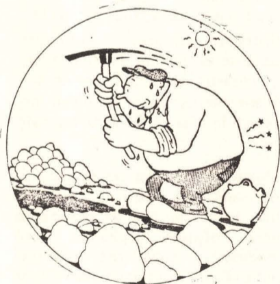
El que tiene trabajo, trabajando para amortizar el costo de su vivienda, más intereses, claro

Amén de estas actuaciones, la política urbanística debe perseguir la edificación forzosa (sobre todo en las áreas centrales de las ciudades), la constitución de patrimonios públicos del suelo (que permitiría construir viviendas en alquiler con las innumerables ventajas que comportaría), política fiscal (para recuperación de plusvalías y de intervención antiespeculativa, así como para atacar la retención injustificada de la propiedad improductiva) y la aplicación de arbitrios diversos.