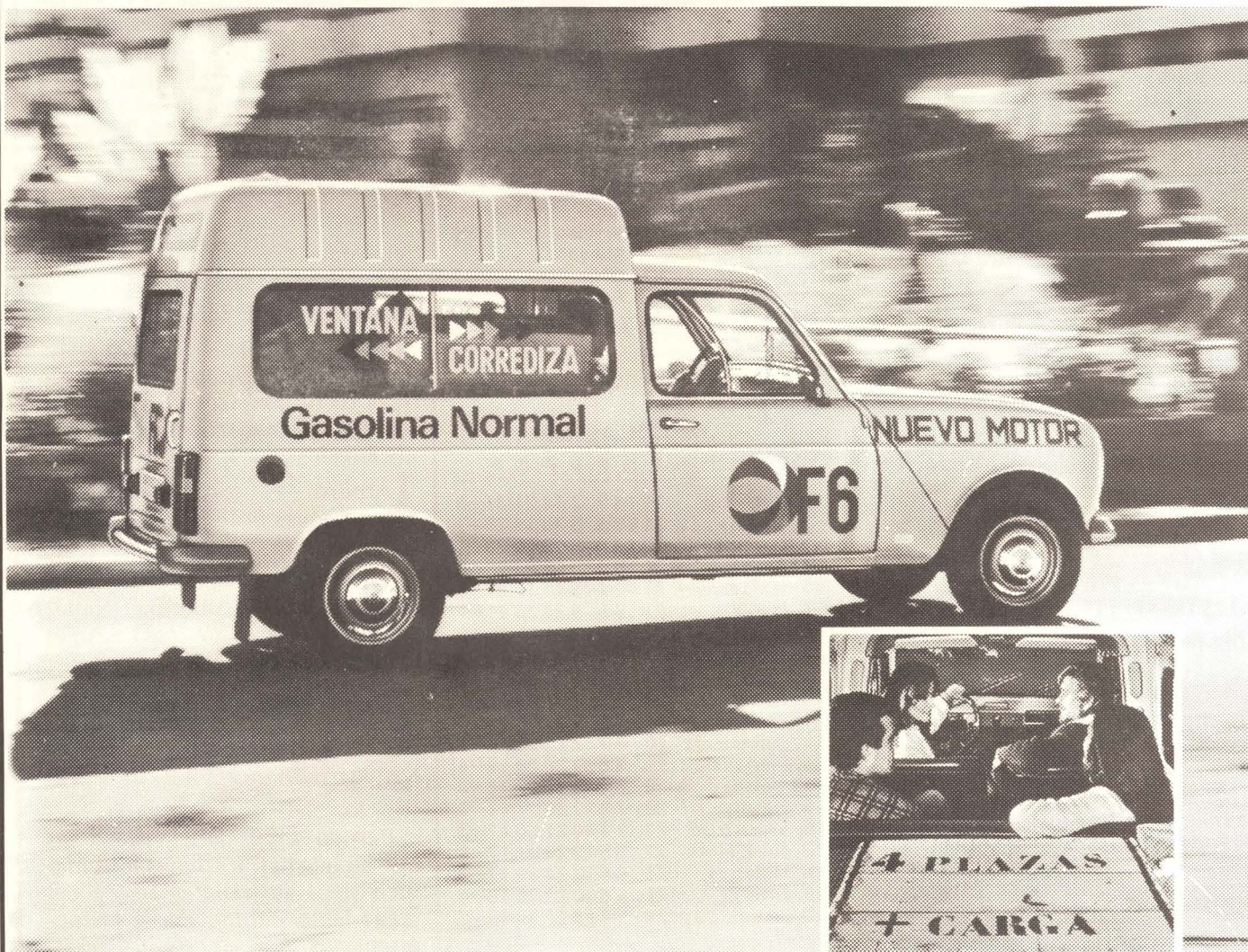
Renault 4 F6 Acristaladas. Potentes. Consumo reducido. Confortables. 2 ó 4 plazas.