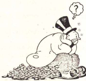
—Especulador ante un incierto futuro— "Vacas Flacas"

mas, mientras que en España se persigue que todos sean propietarios de su vivienda. (69 españoles de cada cien viven en vivienda propia, 25 en alquiler a un particular y 2 al Estado o a la Administración. En la Alemania Federal, por ejemplo, sólo 39 de cada 100