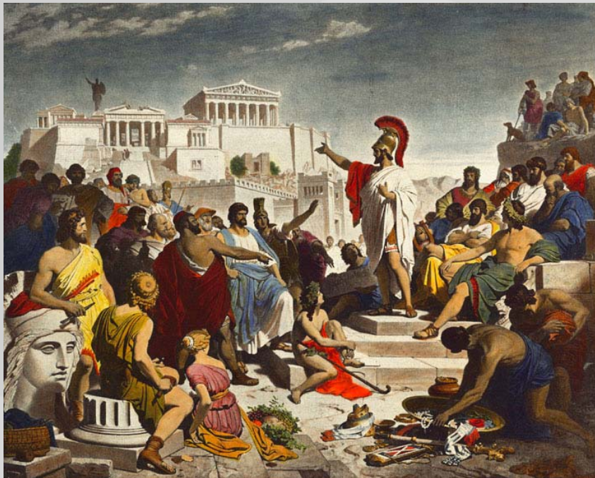
Discurso fúnebre de Pericles