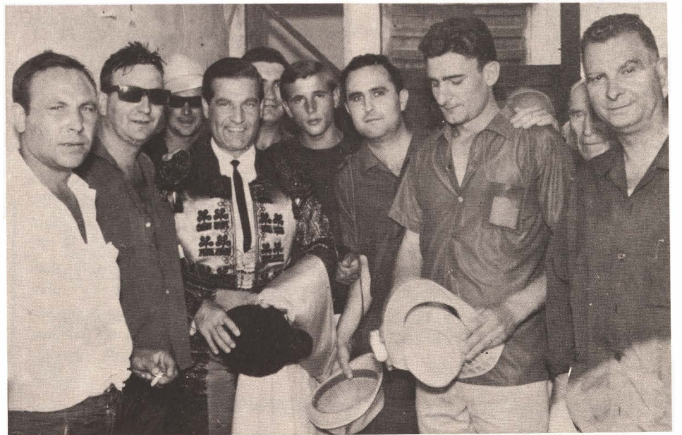
En el patio de cuadrillas de la Plaza en el Año 1965, una representación de la Peña con Antonio Bienvenida (E.P.D.).