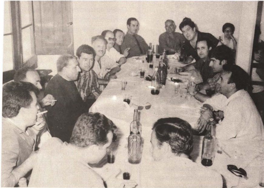
Comida de hermandad, en los locales del Ayuntamiento, en la Ermita.

La nueva Directiva se puso al punto a trabajar por aquella Peña que constituía toda su ilusión. Hizo falta adecuar el Local Social, comprar mesas y sillas, colocar un rótulo exterior y en sitio visible. Los principios son siempre difíciles económicamente: los socios sólo pagaban 5 pesetas. Para aquella cercana Navidad ya compran Lotería, que les dará algún dinerillo. Pero la Peña marcha en pompa, pues en enero del año siguiente se amplía el número de socios, ante la cantidad de peticiones, en 70, no admitiéndose a nadie más a no ser en caso de baja de los ya existentes.