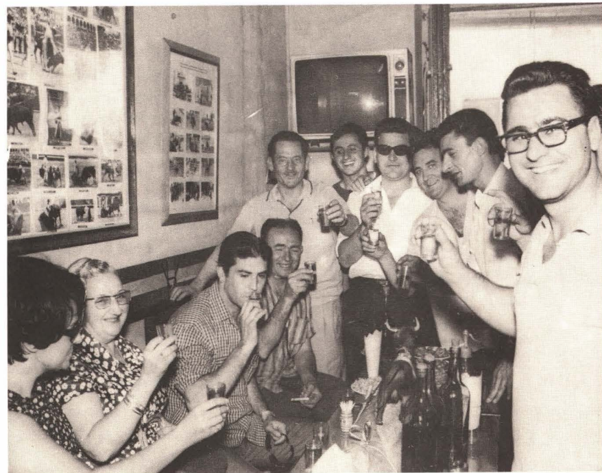
Brindando por la Peña 1966, el torero Jaime OSTOS y socios, en el local del Bar Gandesana.