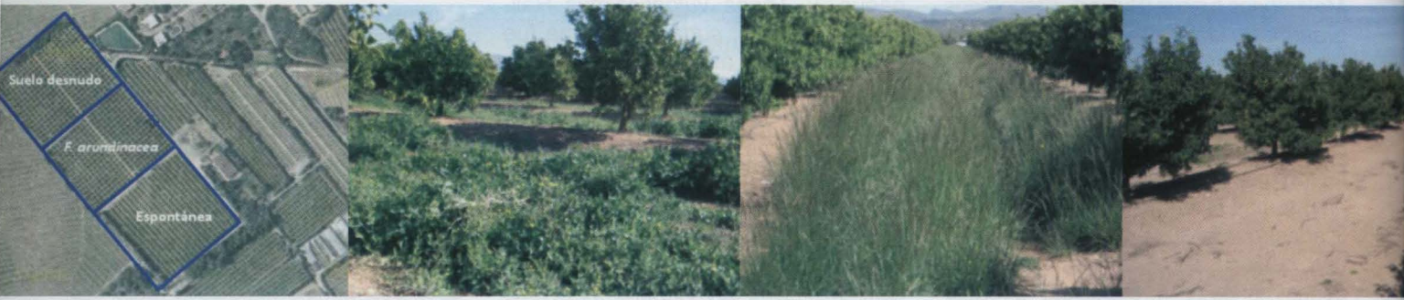
Figura 2. De izquierda a derecha: Vista aérea de una de las parcelas y los tres sistemas de gestión del suelo, cubierta espontánea, cubierta sembrada de F. arundinacea y suelo desnudo.