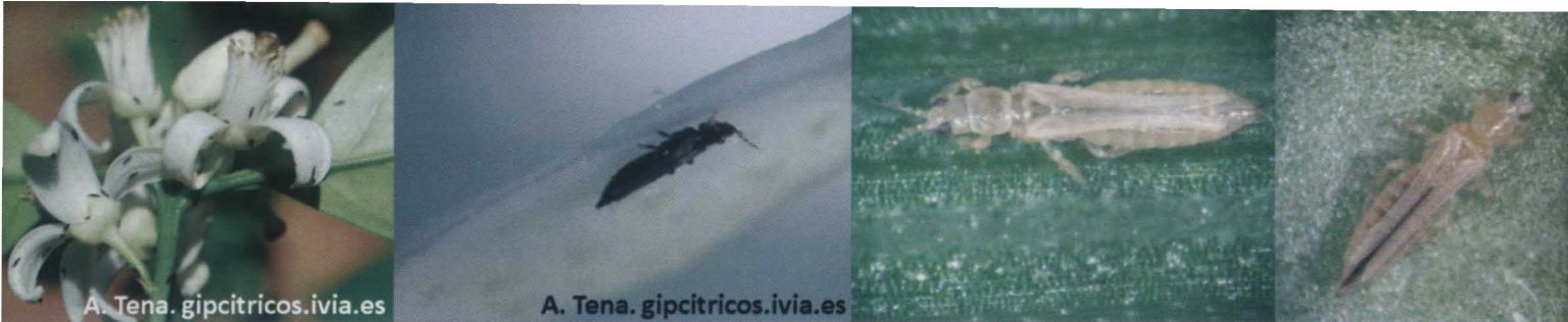
Figura 1. De izquierda a derecha: flores con presencia de P. kellyanus (Foto de A. Tena en gipcitricos.ivia.es), detalle de adulto de P. kellyanus (Foto de A. Tena en gipcitricos.ivia.es), detalle de adulto de A. obscurus y detalle de adulto F. occidentalis .