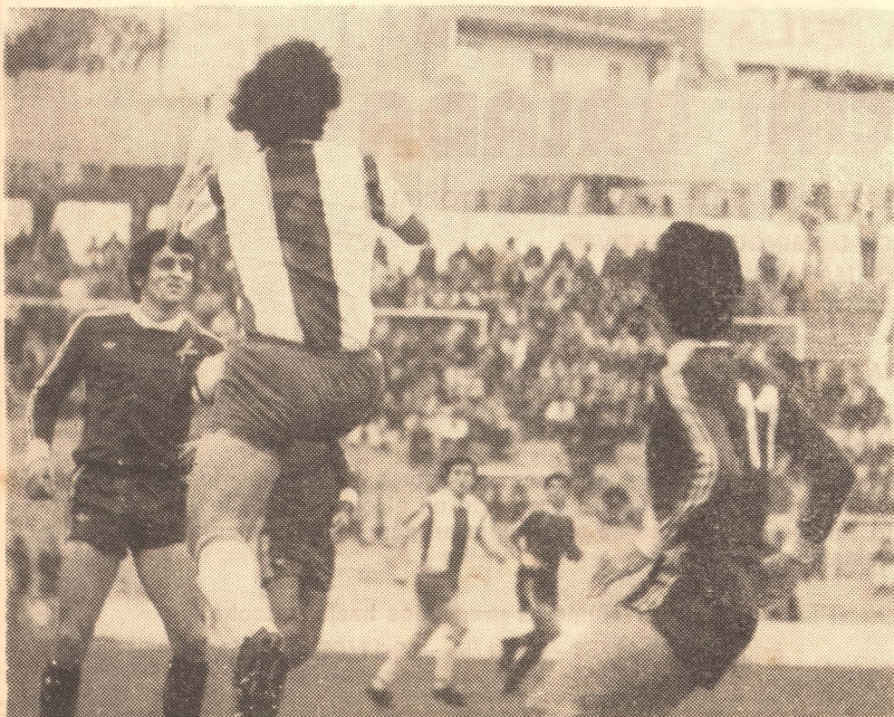
Imágenes del encuentro disputado el pasado domingo, en el «Luis Sitjar», entre el Mallorca y el Vinaroz.