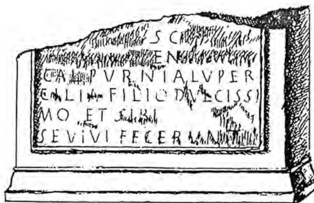
Figura 4. Segons el manuscrit de Valcárcel (1852).

Com ja va assenyalar Corell, no és fàcil establir la lectura d'aquesta inscripció fragmentària, desapareguda i transmesa amb diverses variants. Només la font anònima de Cortés i Seguer la van veure completa: el primer la representa sencera, però només amb el text inserit en un rectangle (Fig. 2), i el segon partida en dos fragments, però amb la forma del suport ben detallada (Fig. 3). El dibuix de Seguer ens ha arribat a través de tres còpies: una de Sales, que al seu torn copia Ribelles, i l'altra de Valcárcel, qui només va poder veure la part inferior (Fig. 4). Els quatre dibuixos presenten diferències entre si, que augmenten en les edicions posteriors de l'epígraf, i fins i tot afecten al número de ratlles: si en les quatre còpies assenyalades el text té vuit ratlles, en l'edició de Delgado de l'obra de Valcárcel en té nou, que Hübner amplia en el CIL II fins a deu. De més a més, hi ha una diferència entre els dos dibuixos de Valcárcel que representen la inscripció: en el que representa la meitat inferior que ell pogué veure directament figura la r. 6, que no apareix en el que la representa sencera, com ja va assenyalar Hübner. La lectura de les 4 primeres ratlles, entre les quals es troben les més danyades (2-4), ha donat peu a diverses