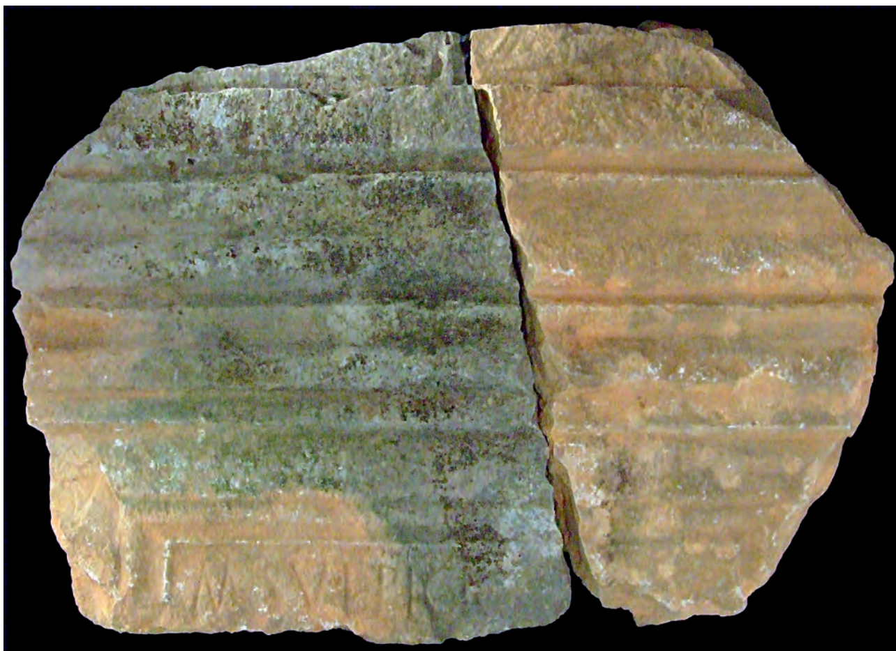
Figura 1. Els dos fragments recuperats de la inscripció CIL II 2 /14, 767.

cyma recta , un xamfrà invers, una cyma recta , un llistell i un xamfrà. Sobre ella es conserva part del coronament del monument fins a 7,5 cm d'altura. En la seua cara anterior es veu l'extrem inferior de la decoració en baix relleu que sembla constar d'un element vertical al centre i dos motius asimètrics als costats impossibles d'identificar.