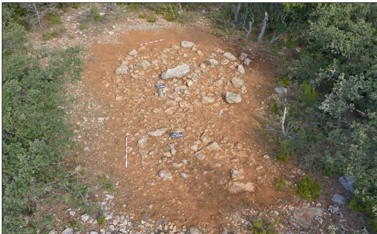
Figura 2. Agrupació tumular