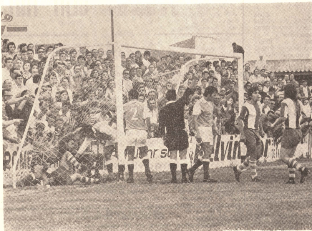
VINAROS - JEREZ (2-1). El discutido gol anulado al conjunto de casa.

La fecha de un 16 de junio quedará ya asociada para siempre en la historia del Club. El Vinaroz C. de F. protagonizará esta noche una efemérides, en un sentido u otro, inolvidable. El pronóstico es incierto a más no poder y en Jerez todo es posible. Desde luego y en principio parece que el Jerez Industrial tiene no pocas ventajas a su favor.