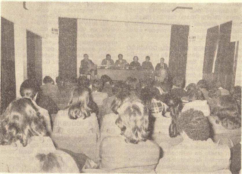
Un momento de las conferencias que vienen desarrollándose en la Casa de la Cultura y, que como puede verse, son seguidas con sumo interés por un gran número de jóvenes.

El pasado día 14, en el Salón de Actos de la Casa de la Cultura, tuvo lugar la segunda conferencia de las cuatro que completan el ciclo que se está llevando durante la celebración del V Foro Local Juvenil.