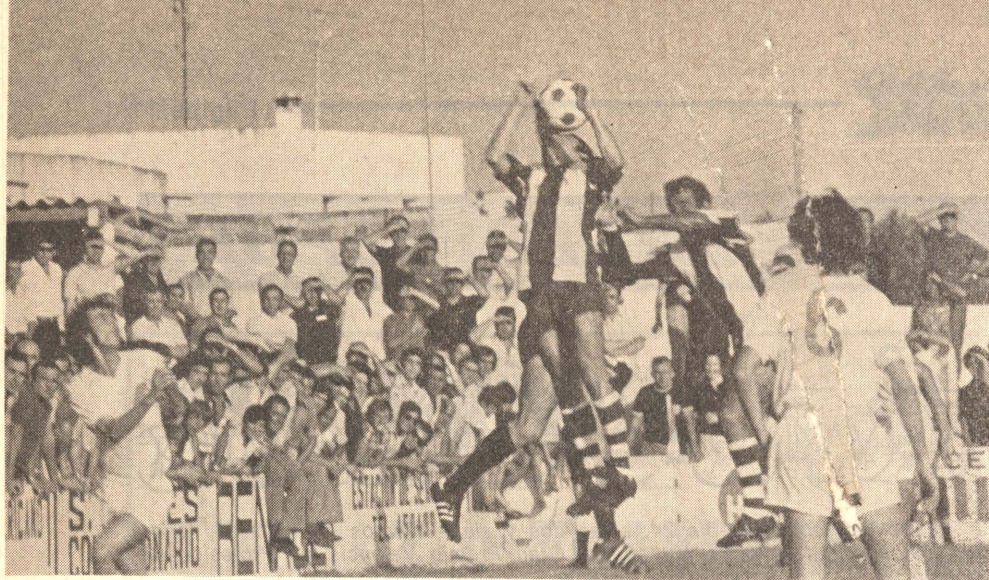
El Olímpico entró en la Liga 74 con buen pie y se llevó a sus lares un positivo. Partido de vuelta en La Murta, con enorme suspense. El año anterior se venció allí, y todo el mundo de aquí desea se repita la gran hazaña.