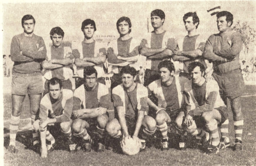
Nuestro equipo en ruta hacia la meta de honor, tiene que cumplimentar mañana una cita importante. Una finalísima más, pero este partido de Burriana, por circunstancias que están en el ánimo de ustedes, reviste un interés especialísimo. El Vinaroz y el Burriana, mañana, en el S. Fernando, a las 3'30 de la tarde, protagonizarán una contienda apasionante y brava en pos de un resultado de la mayor trascendencia.