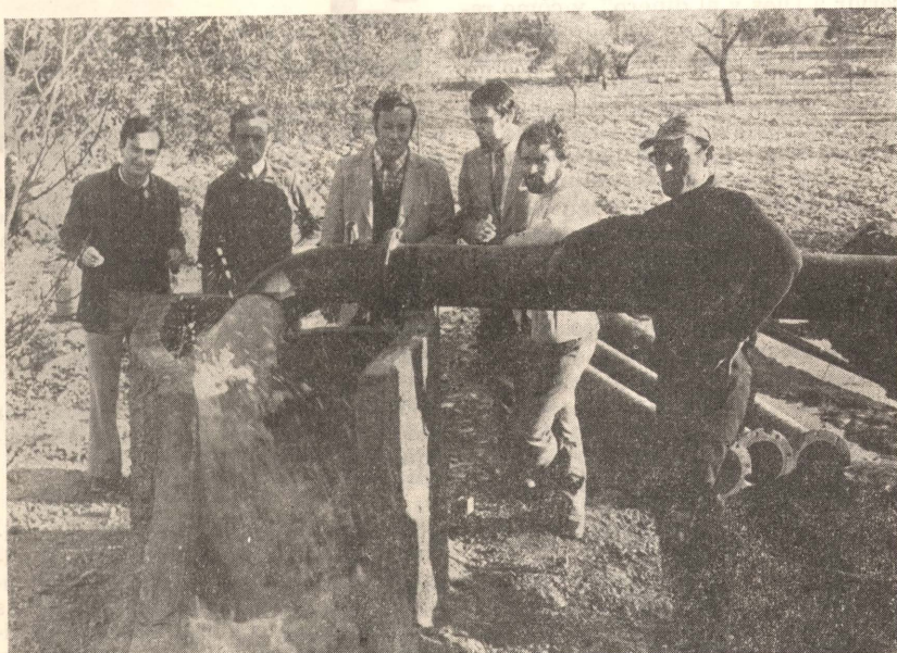
El pozo de las "Sutarrañes"