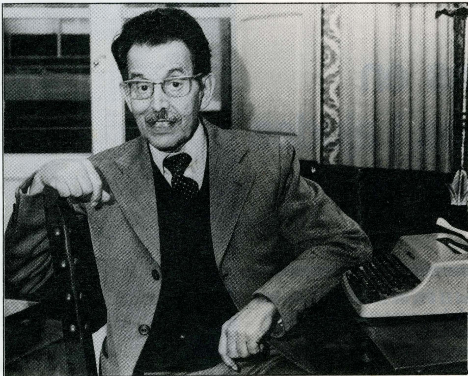
L'escriptor ha vist recompensada per Diputació la seua tasca