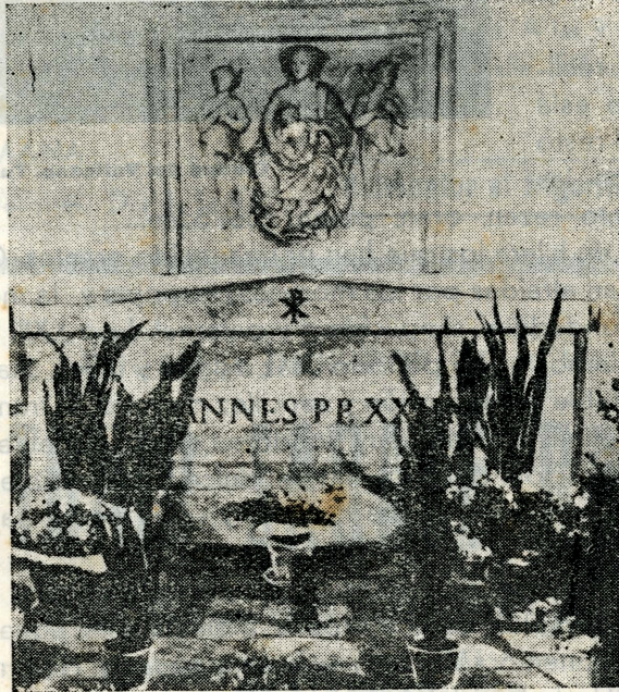
Ciudad del Vaticano. Tumba de S. S. Juan XXIII

tellos la bondad, con fulgores de alegría, con semblante de evangelical sonrisa el rostro impalpable y resplandeciente del bondadoso y paternal Papa Juan XXIII.