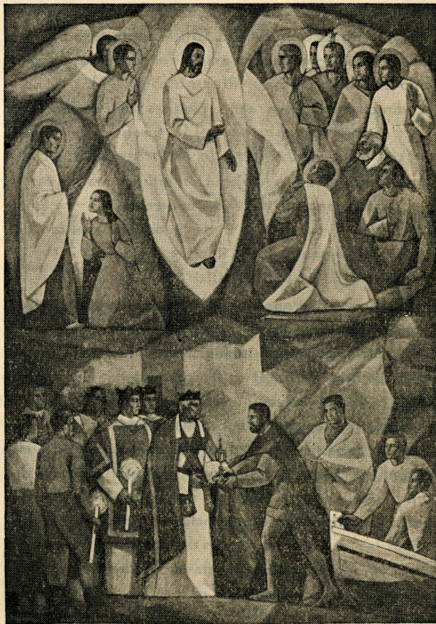
Panel mural de la izquierda. - San Sebastián, Mr. y Vinaroz.