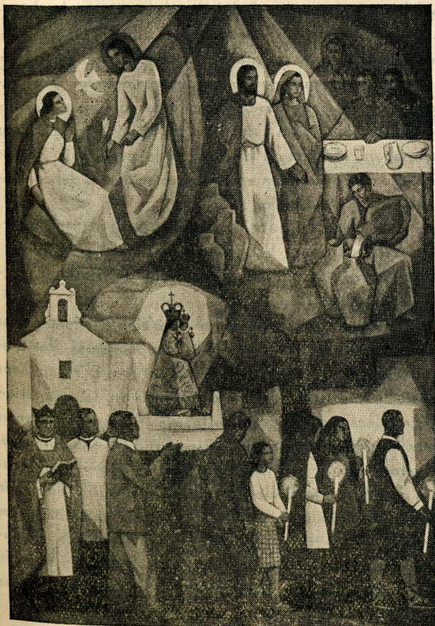
Panel mural de la derecha. - Patronazgo de la Virgen de la Misericordia.

mente en Italia (1953). Ha triunfado en numerosos concursos de su especialidad y obtuvo, por oposición, tres becas: en 1947, de Ayuda Escolar; en 1949, para viaje por España y, en 1953, para Italia. Forma parte del grupo «LUCERNA» de pintores barceloneses, con entera independencia, sin esclavizarse a fórmulas ni a prejuicios de escuela. En la concepción, forma y ejecución de sus pro-