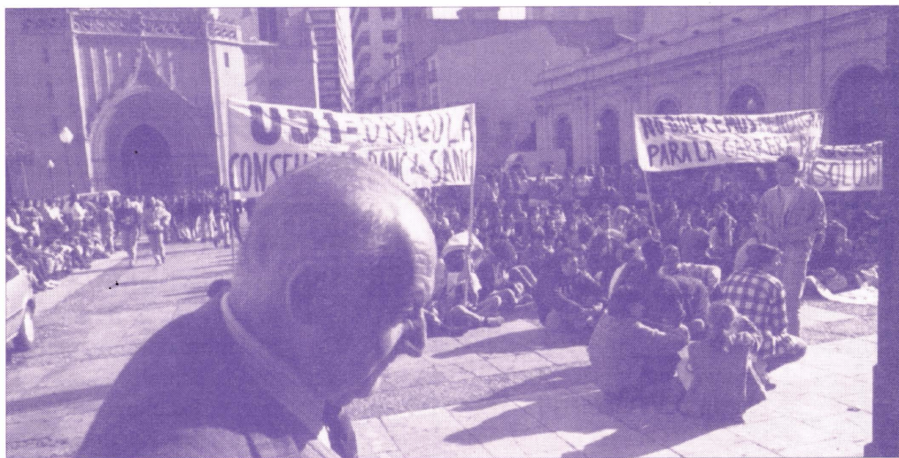
Mil estudiants universitaris participaren en la manifestació

El document marc difós per la Delegació d'Estudiants reclamava, entre altres moltes aspiracions, un augment de les assignatures optatives, l'adopció de mesures que eviten la coincidència d'horaris en les convocatòries d'exàmens, reducció del nombre d'estudiants per grup de pràctiques, garanties perquè siga possible un debat previ a l'aprovació dels pro-