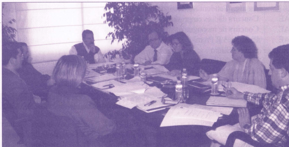
El nou Equip de Govern de la Jaume I aposta per la continuïtat