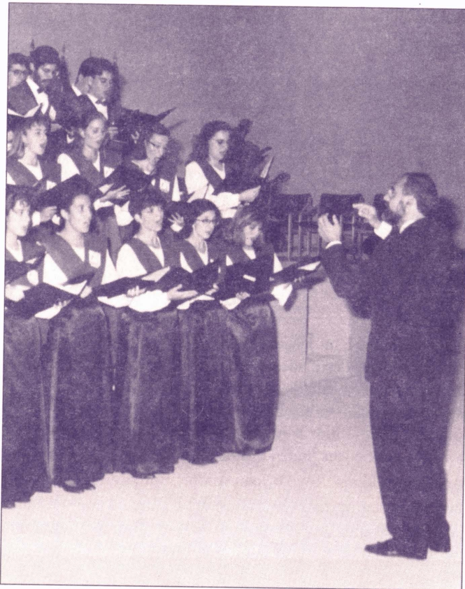
L'oferta cultural de l'UJI és ampla i diversa

L' Aula de Teatre desenvolupa, per una banda, cursos d'iniciació i formació dramàtica, i, per altra banda, organitza dos cicles anuals: Ciclorama , en primavera, i Reclam , a la tardor. Oberts a tota la societat, tenen com a objectiu donar a conèixer les darreres i més avantguardistes manifestacions teatrals, siga d'interpretació, direcció o exposicions sobre activitats escèniques. Aquest darrer