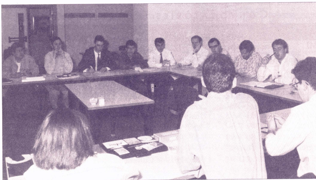
Representants de 15 universitats es van reunir a Castelló

R epresentants estudiantils de quinze universitats han decidit crear el Consell Estatal de Representants d'Estudiants (CERES), per unir els esforços de les representacions i associacions d'estudiants universitaris. L'acord es va prendre en les II Jornades de Representants Estudiantils, celebrades els passats dies 27 i 28 de març al Campus del carrer Herrero de la Universitat Jaume I.