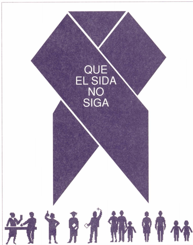
La lluita contra la sida ens afecta a tots igual

El contingut de la primera jornada inclou la ponència titulada Aspectes epidemiològics i tendències de la sida, a càrrec de Rafael Nájera, cap de l'àrea d'investigació del retrovirus del Centre Nacional de Biologia Cel·lular i Retrovirus i de l'Institut de Salut Carles III. Aquesta ponència s'exposarà a les 10 h. A les