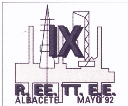
Logo de les jornades d'Albacete

participaren, entre el 6 i el 10 d'abril en el vint-i-setè Congrés Estatal d'Estudiants de Graduats Socials, que va tenir com a seu Salamanca. Aquesta trobada anual serveix per a reflexionar i millorar aquesta titulació, unificant criteris entre les diverses universitats. Van assistir 125 representants i es van debatre tres grans ponències: el Graduat Social davant la integració en el Mercat Únic Europeu; la revisió dels plans d'estudis per centres, amb l'objectiu d'unificar criteris, i la normativa de funcionament i òrgans congressuals.