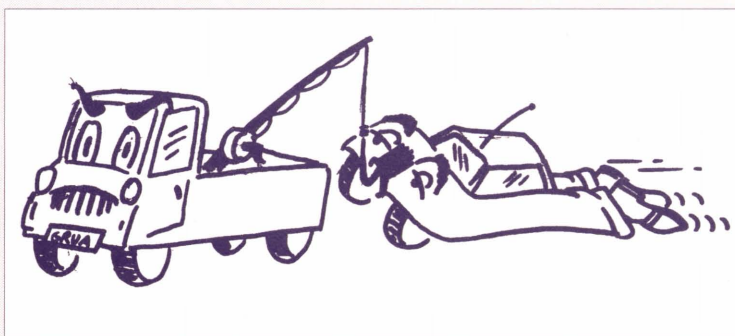
La grúa no se anda con tonterías, es mejor el autobús

La falta de espacio para aparcar en el Campus de Penyeta Roja y el mal uso que se hace del existente ha obligado a la grúa municipal a entrar en acción. Para evitar sustos y multas es conveniente utilizar las líneas de autobuses gratuitas, que descongestionan el campus, ofrecen su servicio a todos los miembros de la comunidad universitaria y constiuyen una forma de transporte más solidaria. Deja el coche en casa por el bien de todos y, de paso, ahórrate problemas.