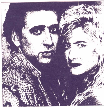
Fotograma de "Corazón Salvaje"

• El Centre Excursionista de Castelló realizará, del 16 al 20 de abril, su acampada de Semana Santa, a la cual estáis invitados. Será en Penyalgosa, hay que llevar equipo y viandas. El CEC acabará, durante la acampada, el trabajo de campo previo a la edición de una guía del paraje y realizarán numerosas excursiones. Podéis dirigirlos a la sede del CEC, en la calle Isabel Ferrer de Castelló.