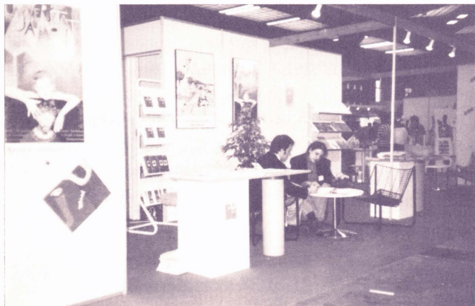
El stand de la Jaume I en Bruselas

LA CALIDAD DE LOS ESTUDIOS PREOCUPA AL MOVIMIENTO ESTUDIANTIL