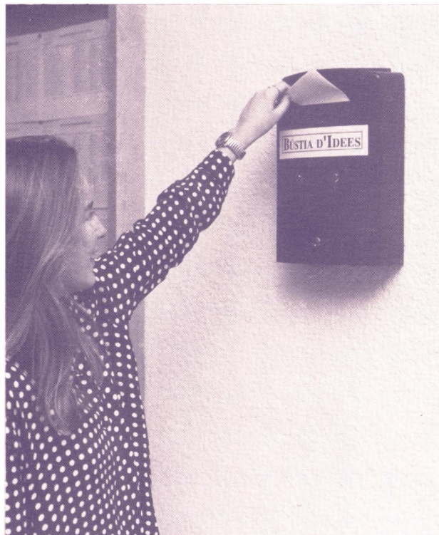
Las Bústies d'Idees esperan tus sugerencias

Otro tema que preocupa a la comunidad universitaria es la situación de la cafetería del Campus de la Carretera de Borriol y, en buena lógica, muchos estudiantes solicitan de sus compañeros que no se entre comida ni bebida, ni que tampoco se juegue a las cartas, en las salas de estudios y en la Biblioteca. Por último, respecto a la infraestructura, se pide mejor señalización en Castelló para llegar a los diferentes campus.