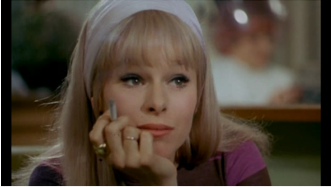
Peppermint Frappé , Carlos Saura, 1967