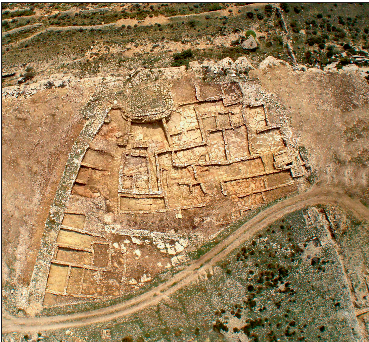
Figura 5. La Llomena Comuna (Castellfort)