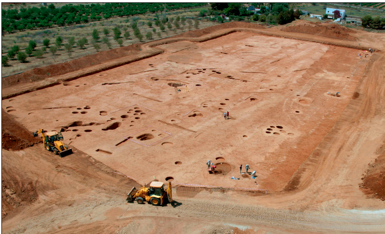
Figura 4. Jaciment neolític de Costamar.

A la Lloma Comuna de Castellfort s'ha excavat en extensió una bona part d'un jaciment excepcional amb nivells ibèrics i del Ferro antic. Les excavacions sufragades per l'empresa adjudicatària dels Plans Eòlics han permès descobrir un poblat fortificat molt ben conservat, amb cases quadrades agrupades en illes, pel mig del qual sembla que ja passava l'actual via pecuària.