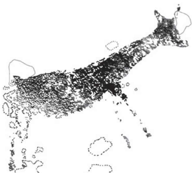
Figura 3. Calc de la cérvola pintada de la cova del Bovalar (Culla), segons R. Martínez y P. Guillem.

Durant aquests anys hem començat a ser conscients de la importància que tingué la vall del Palància en el poblament antic. A banda de jaciments a l'aire lliure com Algezares i Romaní, s'han excavat parcialment les restes d'un dipòsit en brexa en la Fuente de los Borrachos (Viver). Ací hi aparegué un ascla levallois i nombroses restes de fauna fòssil, atribuïda al Plistocé mitjà, que fa d'aquest jaciment el més antic trobat fins ara en les comarques de Castelló. Per altra banda continuen les excavacions al Tossal de la Font, on gairebé s'han exhaurit els nivells plistocens coneguts.