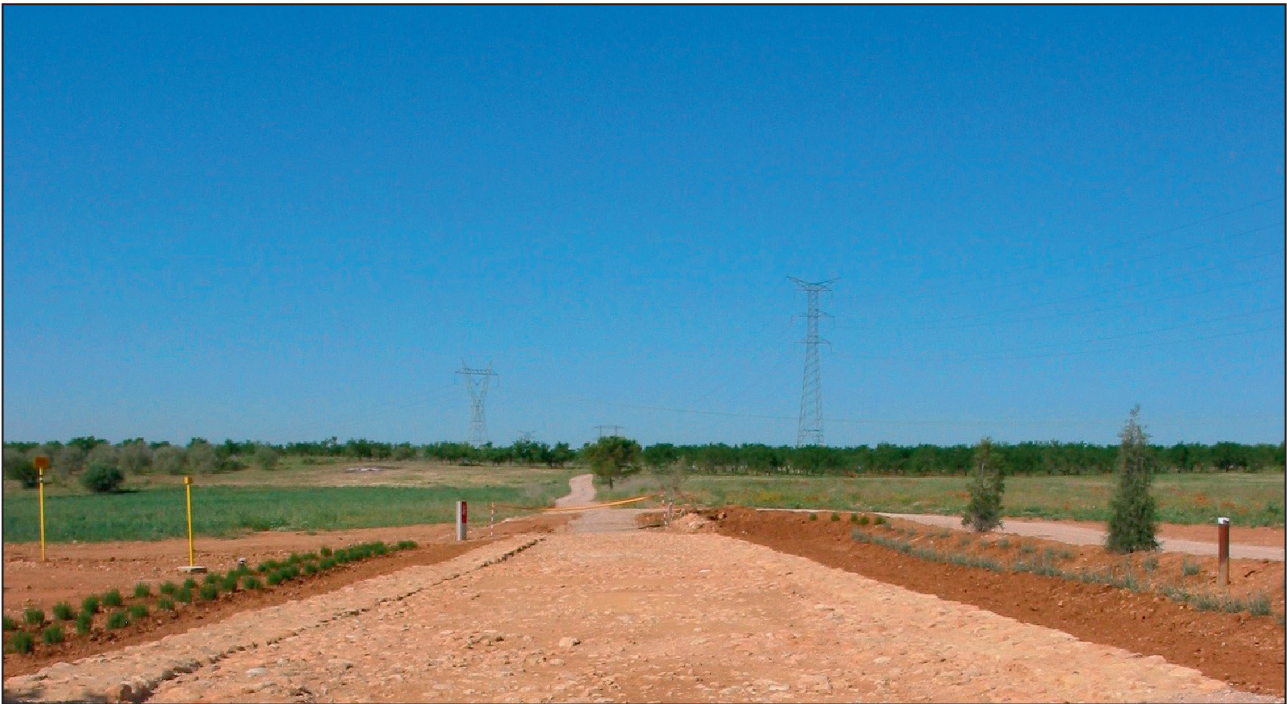
Figura 6. Restauració d'un tram de la Via Augusta (Benlloc).

excavat una part, i les estructures arquitectòniques son tan excepcionals, que si s'excavara una superfície major, podria posar-se en valor. Malauradament està en un estat d'abandó incompreensible.