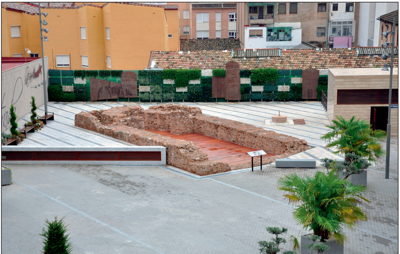
Figura 7 y 8. Ermita de Santa Bárbara (Segorbe). Durant el procés d'excavació i després de la seua restitució.