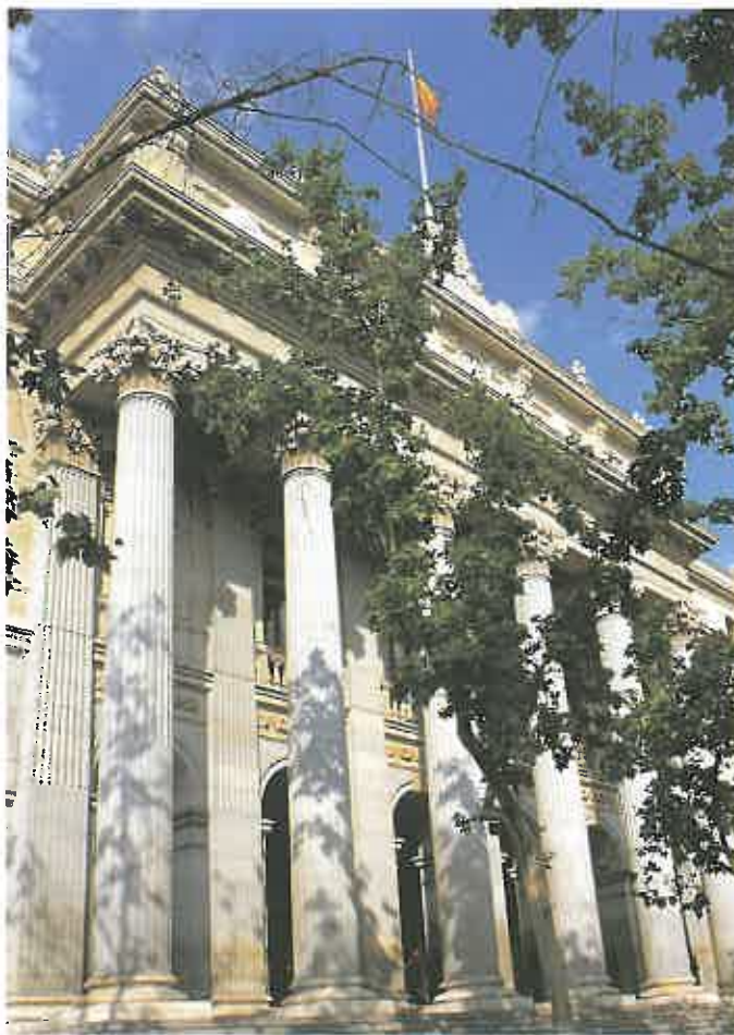
La Bolsa de Madrid ha experimentado también en las últimas semanas fuertes altibajos.

FMI, recortar los tipos de interés un 0,25 por ciento el penúltimo día del mes de septiembre, hasta un 5,25 por ciento, en un intento de inyectar confianza en los mercados y frenar el riesgo de retroceso económico. A pesar de que ésta fue la primera vez que