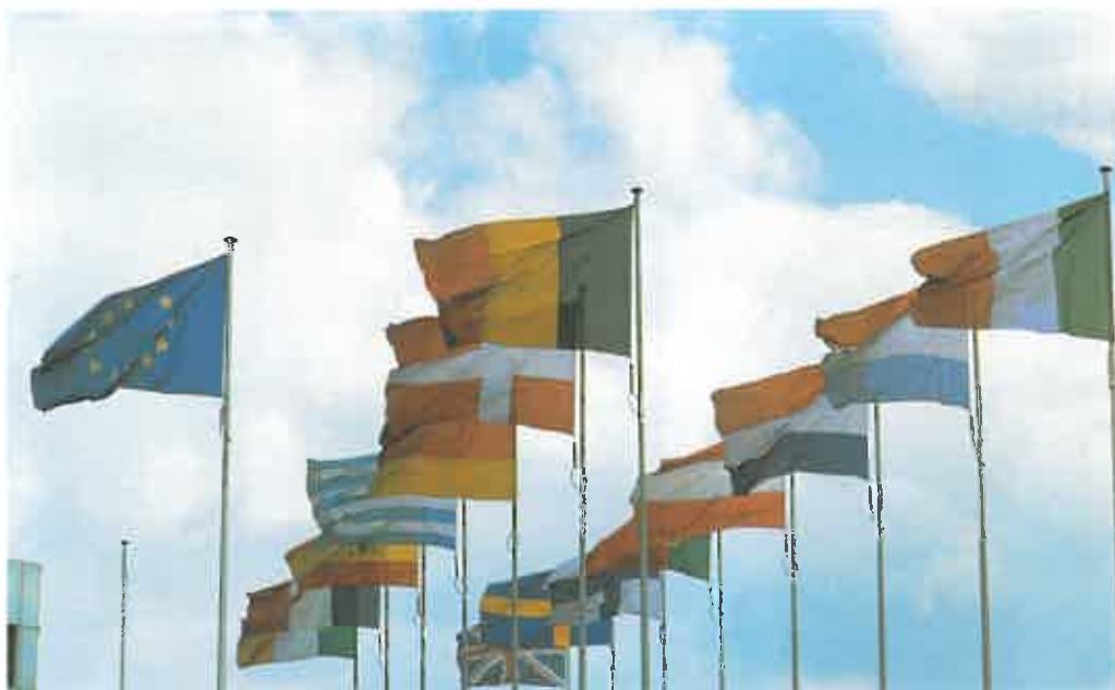
Los países de la zona euro han resistido con firmeza la crisis financiera internacional.