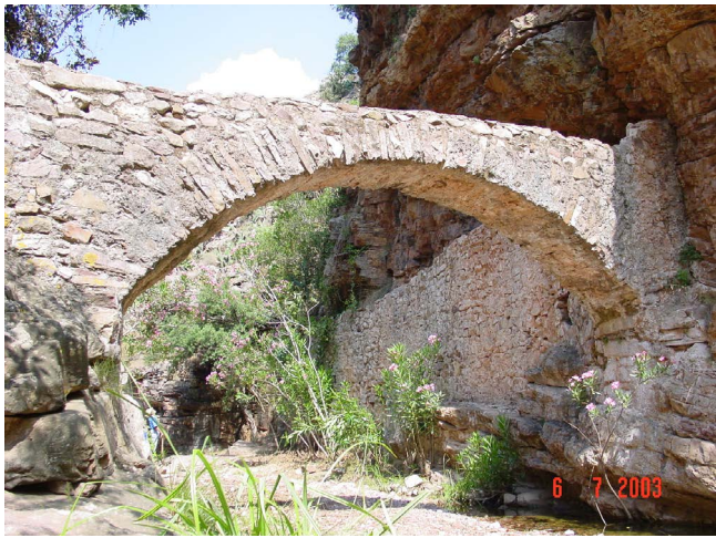
Figura 5. Arco romano. Arquet