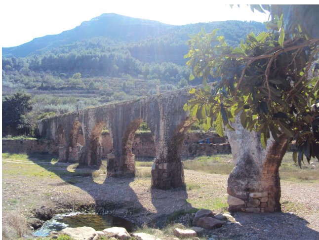
Figura 5. Acueducto. Pont de l'aigua

La existencia de numerosos asentamientos y villas en Uxó y pueblos circundantes (El Pinar y Corrallets en Artana; barrio de l'Alcudia, camí de Cabres, camí de Clotxes, Font del Canyet, Pla d'Odell, Horta Seca, en La Vall d'Uixó; l'Alquería y Rajadell, en Moncofa; la Font Calda, Santa Bárbara, el Secante, en Vila-Vella, etc.), nos lleva a considerar la posibilidad no de villae en el sentido de «centro agrario de cierta envergadura que tenía por finalidad la producción de excedentes» (Jàrrega, 2011), pero sí explotaciones menores dependientes de las villae de La Vall d'Uixó.