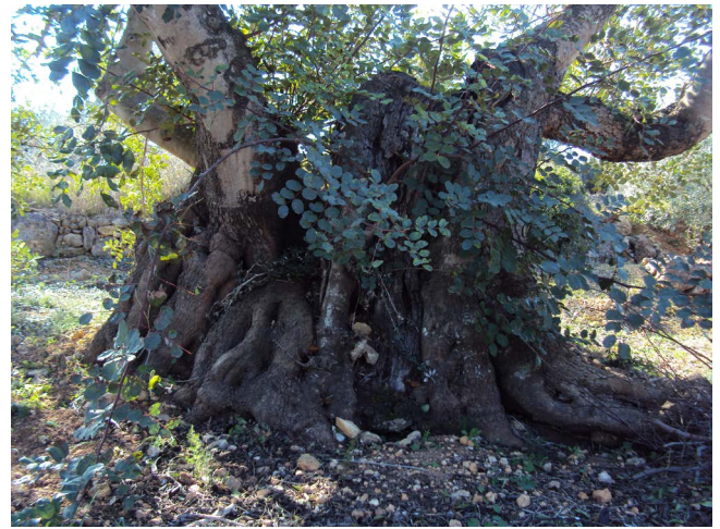
Figura 6. Algarrobo centenario