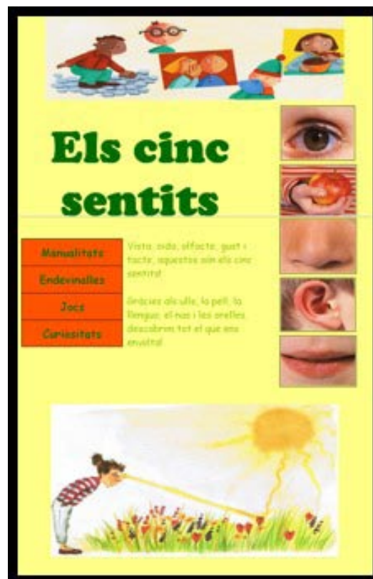
Imatge 5. Pàgina principal de la web "Els Cinc Sentits"