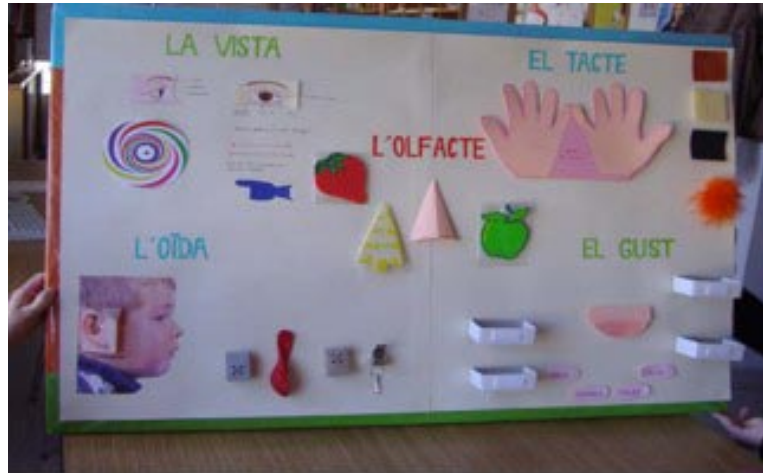
Imatge 4. Mural "Els Cinc Sentits"