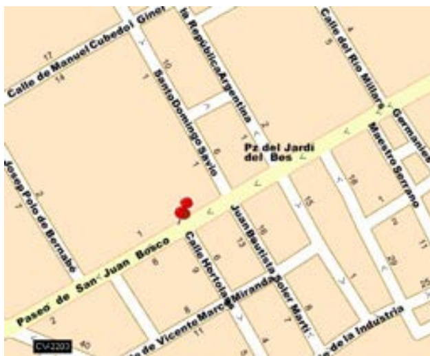
Imatge 1. Plànol de la situació del col·legi San Juan Bosco

En l'actualitat, el centre es troba integrat dins del casc urbà de la ciutat, en una zona privilegiada. Està molt bé comunicat, ja que es troba junt al Camí d'Onda, artèria que uneix Borriana amb l'estació de ferrocarril, amb la carretera nacional 340 i l'autopista A-7.