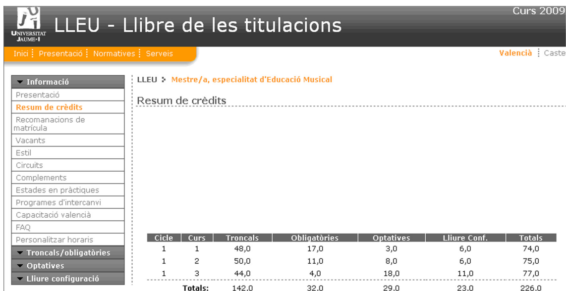
Figura 1. Número de créditos totales de la Diplomatura de Maestro, especialidad de Educación Musical.