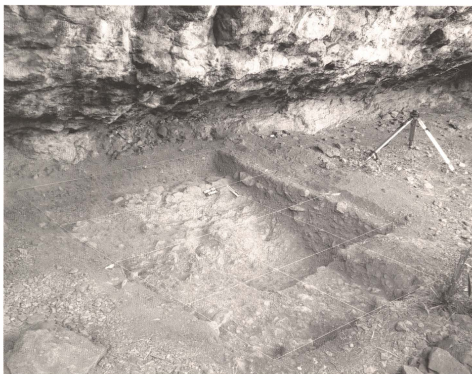
2. Detall de l'àrea excavada, en finalitzar els treballs.