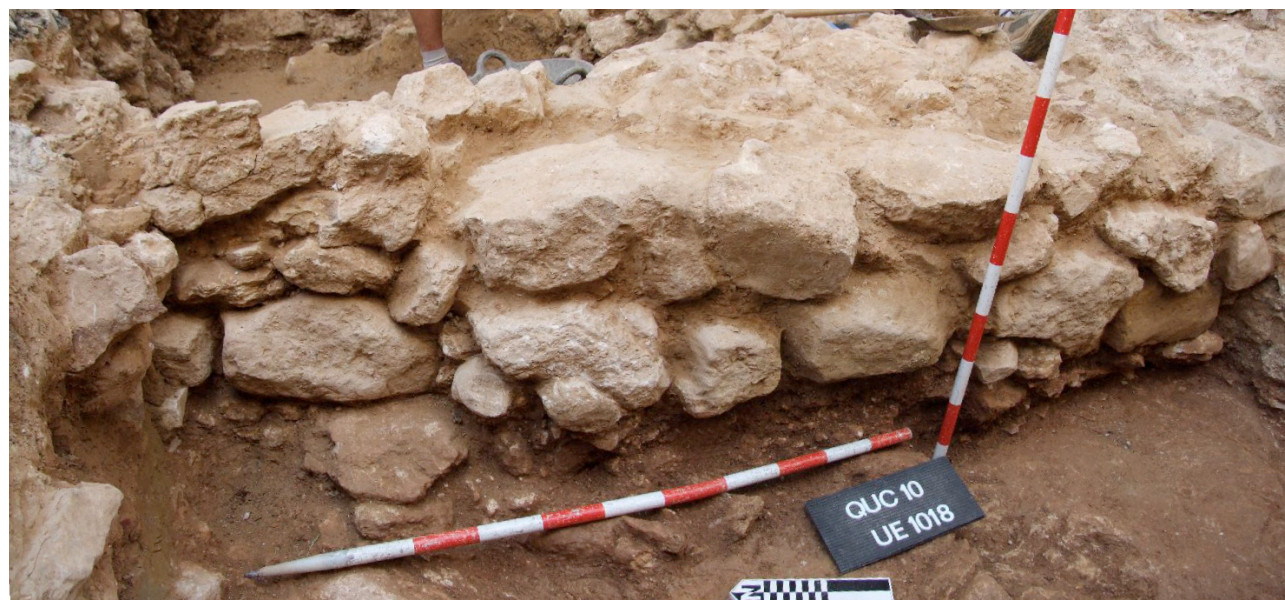
2. Frontal del mur 1008 i del estrat 1018, roca.