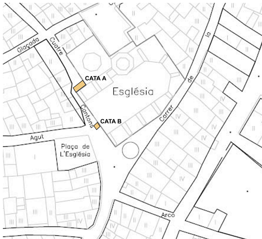
1. Localització de les cales al carrer Quatre Cantons de Traiguera.