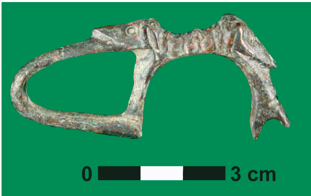
1. Fibula zoomorfa.