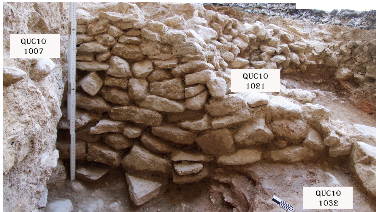
1. Frontal del mur 1021 tallat per la fonamentació de l'església (esquerra) i la fossa contemporània (dreta).