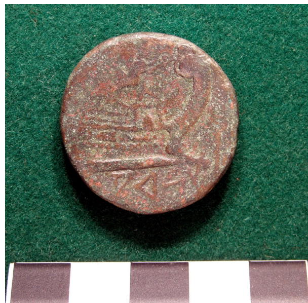
2. As de Saguntum.