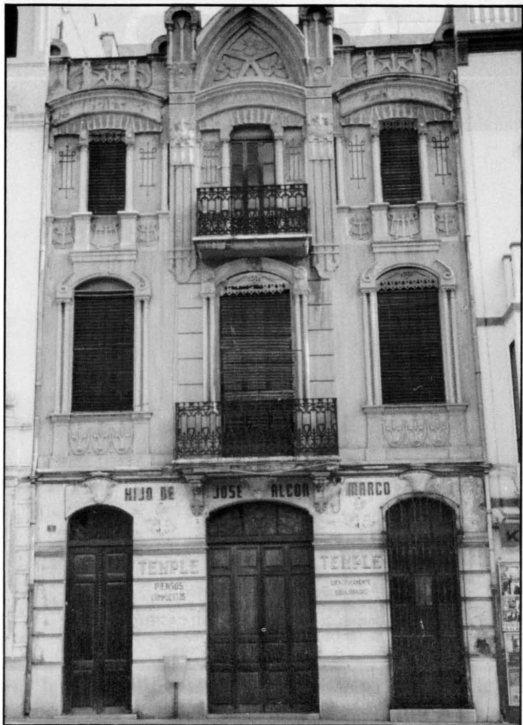
Edificio de la plaza de la Independencia donde estuvo la primera sede del Ateneo.