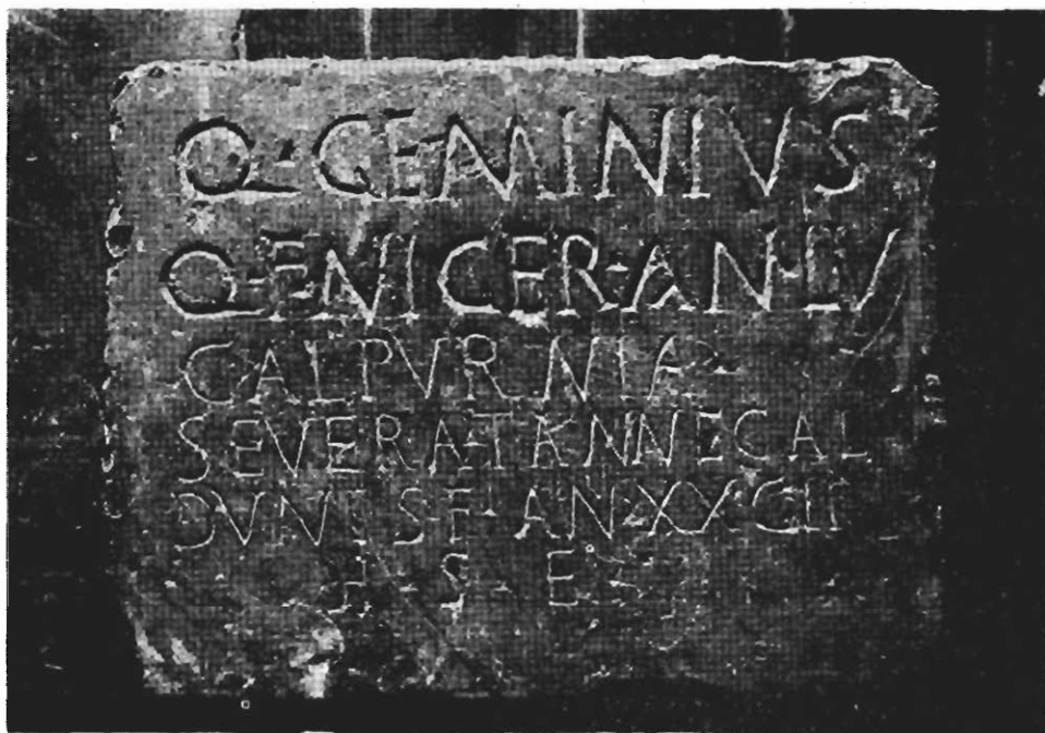
Inscripción núm. 44