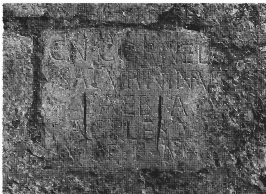
Inscripción núm. 12.