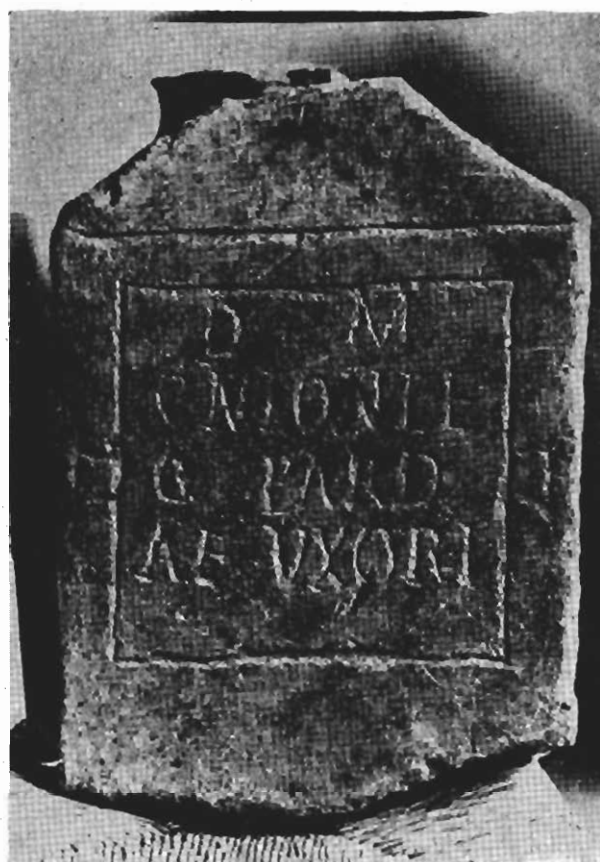
Inscripción núm. 103.