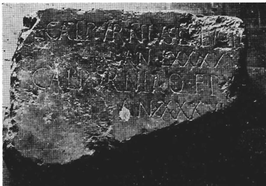
Inscripción núm. 93 (F. Autor).