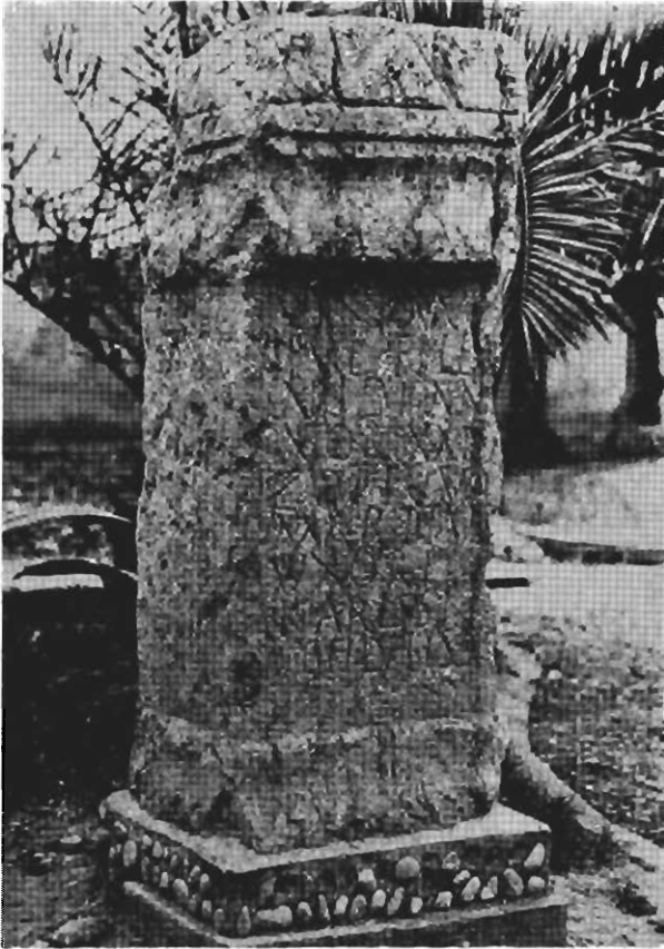
Inscripción núm. 117