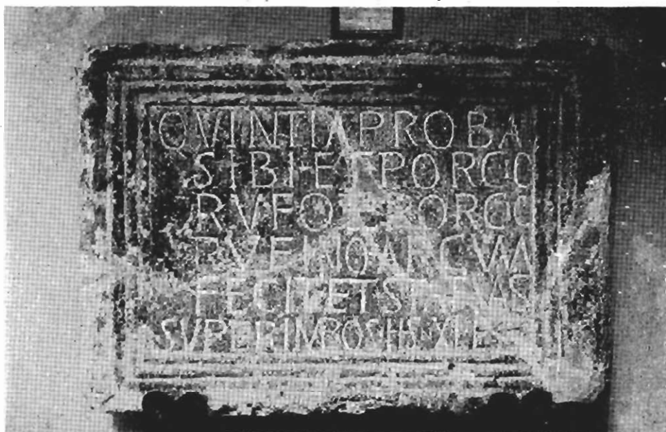
Inscripción núm. 82 (F. Autor).