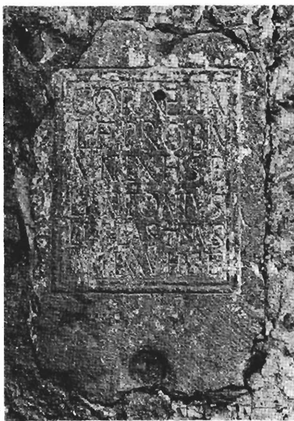
Inscripción núm. 38 (F. Autor)