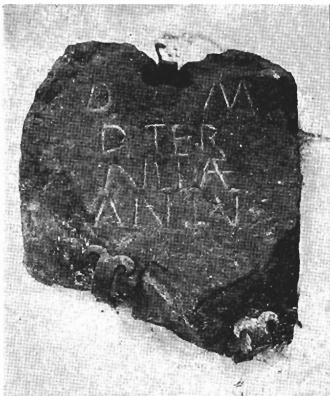
Inscripción núm. 81.