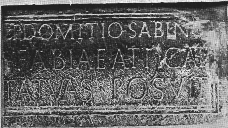
Inscripción núm. 131.